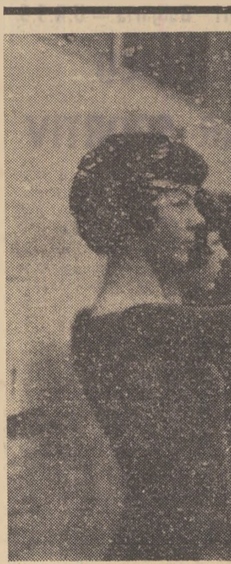
Acest grup de tinere iubitoare ale gimnasticii moderne pot fi întâlnite de două ori pe săptămână în sala de sport „Erwin Panndorf” din Gera. Ele și-au format un grup de demonstrație cu prilejul celui de al 5-lea Festival de gimnastică și sport al R.D. Germane de anul trecut și de atunci au rămas împreună, practicând cu entuziasm disciplina îndrăgită.

Cei opt aspiranți la titlul de campion mondial vor trebui să dispute, timp de o săptămână, câte trei sau patru curse în cadrul unui reușit, conducând de fiecare dată un anumit număr prin tragere la sorți. Ei vor duce oarecum o viață de nomazi, deoarece șapte zile se vor deplasa din hipodrom în hipodrom — în Statele Unite și în Canada — la mai sau numai sute de kilometri depărtare unul de altul. Laureatul va fi desemnat de clasamentul punctelor obținute în decursul acestei săptămâni, memorabile în istoria curselor de trap.