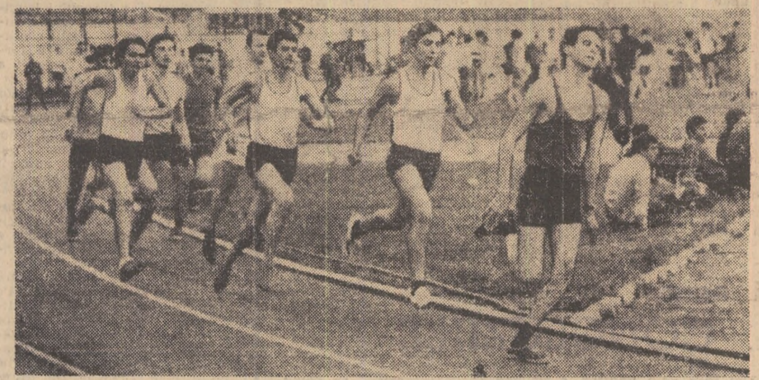
Cîți vor rezista, oare, acestei dificile curse pe 800 m?

Bătrînul „Stadion al Republicii“ sub o infuzie de tinerețe. În cursa cu barul, invingător iese... sportul! „Campionatul“ Universității — un cuvînt pretențios, dar un pretext ideal