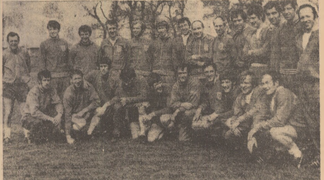
Alf Ramsey (în centrul fotografiei), încadrat de Banks (stînga) și Bobby Charlton (dreapta) și... de întregul lot. Englezii au făcut la Guadalajara o primă luare de contact cu terenul mexican. Pe fețele lor zîmbitoare se citește optimismul. Să însemne asta ceva?

Din cauza calamităților naturale din unele județe ale țării, Federația română de fotbal a hotărît să amîne următoarele partide din etapa de miine a campionatului diviziei C: toate jocurile din seriile a VI-a, a VII-a, și a VIII-a; din campionatul republican al juniorilor și școlariilor: toate meciurile din seriile a X-a, a XI-a, a XII-a, a XIII-a și a XIV-a. Au mai fost aminate jocurile din "Cupa României" Portul Constanța — A. S. Armată