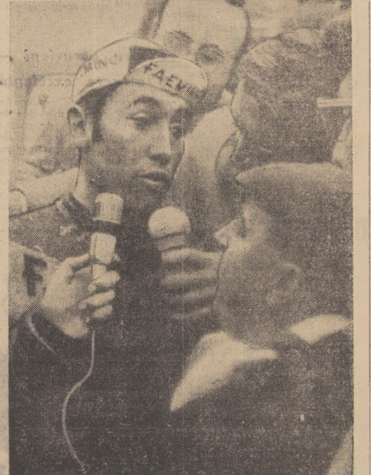
„Nu sînt dopat!” declara Eddy Merckx la Savona, anul trecut în mai, cînd organizatorii lui Giro îi anunțau descalificarea. Duelul Merckx — Gimondi, încheiat atunci cu o lovitură de teatru, reîncepe luni

O săptămîna bogată în evenimente pe agenda tenisului pe echipe. Campioanele rachetelor, reușite în 22 de reprezentative naționale, se pregătesc să înceapă marți, la Freiburg, în R. F. a Germaniei, întrecerea pentru tradiționala „Cupa a Federației internaționale”. O corespondentă feminină a Cupei Davis. Titlul este apărât de echipa S.U.A., care va avea adversarele cele mai redutabile în obișnuitele sale rivalități, tenisioanele austriene, engleze și franceze. Și davis-cupmanii se pregătesc pentru o nouă apariție. Se dispută turul doi în zona europeană a competiției, în cadrul căruia