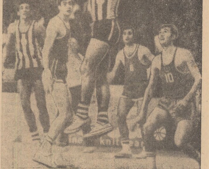
Un atac la panoul echipei U.R.S.S. Fază din meciul de baschet Brazilia — U.R.S.S. (66—64) din cadrul campionatului mondial.