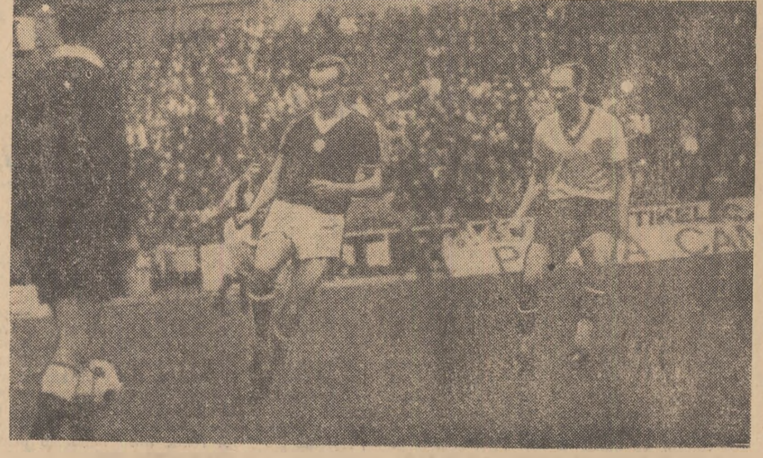
Acțiunea lui Bene urmărită de arbitrul austriac Linomayer (stînga) și suedezul Svensson (dreapta). Fază din meciul Ungaria — Suedia (1—2), care a avut loc sîmbătă, la Budapesta.

ECHIPA Estudiantes la Plata (Argentina) s-a calificat pentru finala „Cupei Americii de sud”. Fotbaliștii de la Estudiantes au învins cu 3—1 (0—0) pe River Plata (Argentina). În finală, Estudiantes va înfrîni echipa Penarol Montevideo. ÎN MECI retur pentru semifinalele „Cupei Franței”, echipa St. Etienne a terminat