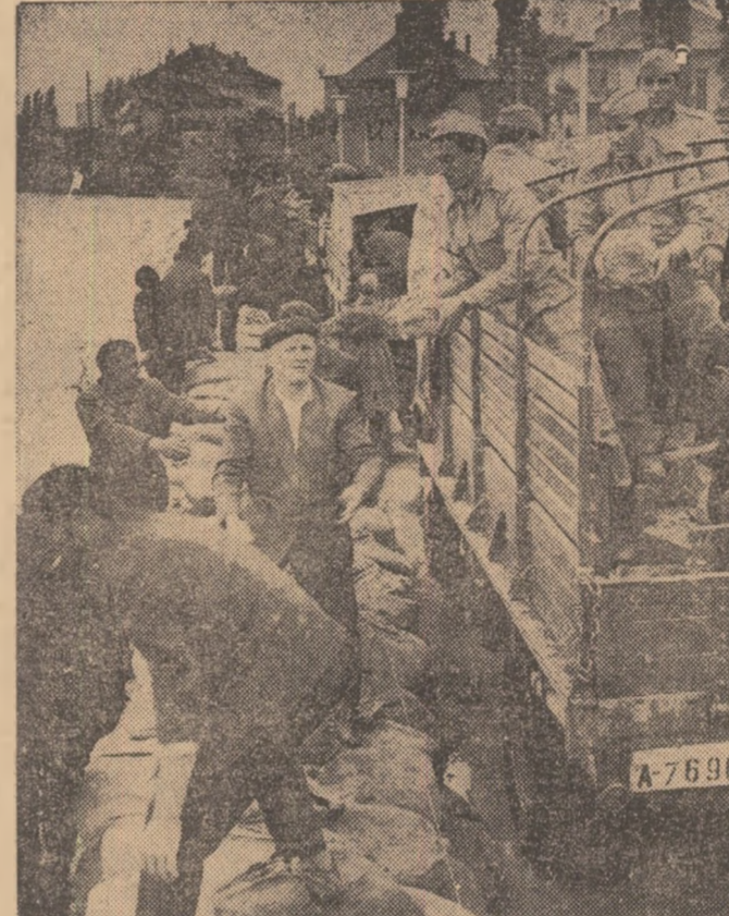
Imagine din Arad. Cot la cot, oameni ai muncii din localitate și militari ai forțelor noastre armate și-au unit eforturile pentru a consolida diguri și baricade împotriva apelor Mureșului. Este o imagine înfrântă deosebi în aceste zile de grea cumpănă, în zonele calamitate și care demonstrează elocvent unitatea de nezdrunecat dintre armată și popor.