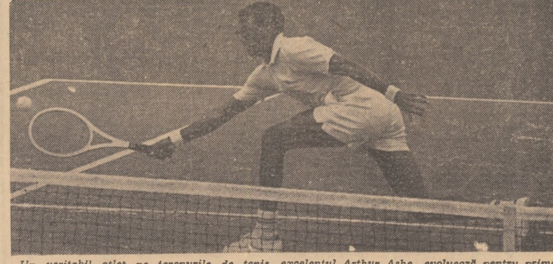
Un veritabil atlet pe terenurile de tenis, excelențul Arthur Ashe, evoluează pentru prima oară în fața spectatorilor bucureșteni

Echipa națională feminină de volei a țării noastre s-a întors din R.D.G., unde a sîntinut 3 meciuri de verificare în compania reprezentativei țării gazdă. Voleibalistele noastre au câștigat toate cele trei înfrîniri, cu 3-2, 3-1 și 3-2.