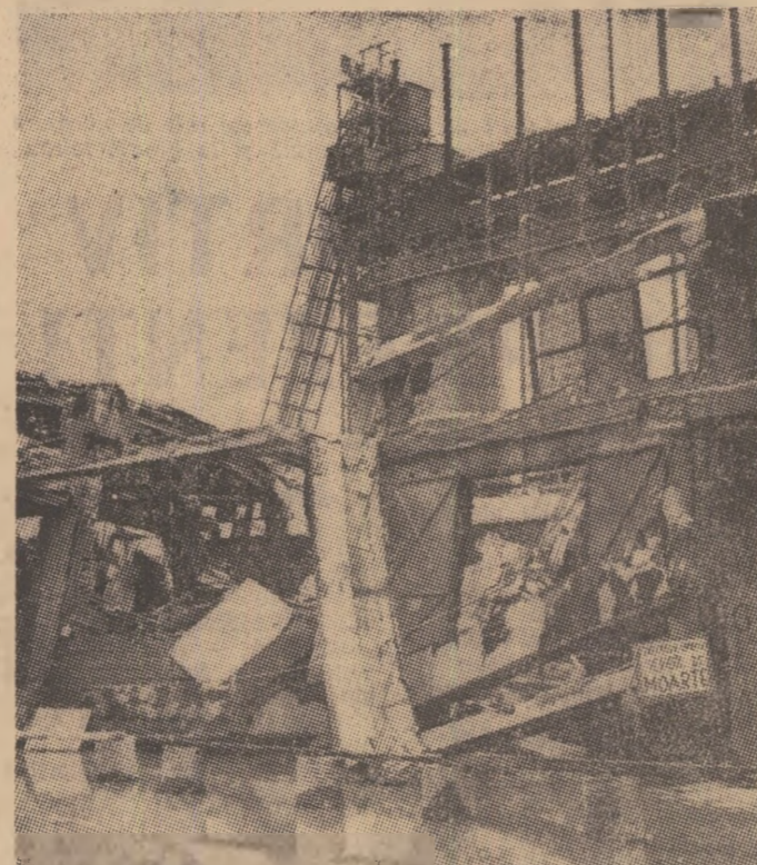
Combinatul din Timișoara, una din stațiile-pilot ale industriei noastre chimice, a fost copleșit de ape. Oamenii sînt însă hotărîți să-l refacă