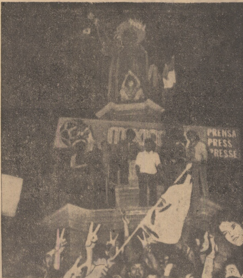
Cu toate că s-au scurs multe ore de la încheierea partidei dintre Mexic și Belgia, înfocății suporterii mexicani continuă să-și manifeste bucuria în plin centrul capitalei. Iată-i pe Paseo De La Reforma, în fața statuii lui Cristofor Columb, cîntînd și dansînd de bucurie că echipa țării lor a ajuns în sferturile de finală.