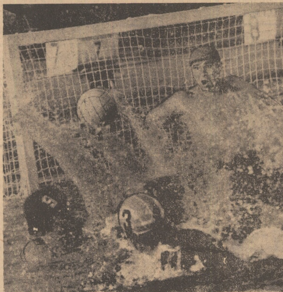
Moment de suspens la poarta echipei Steaua în derbyul poloistic de ieri din piscina Dinamo.