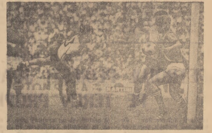
Müller a plonjat spectaculos. Mingea, buclucășă, se strecoară în plasă pe lângă Rivera și sub privirile îngrozite ale lui Facchetti. Din nou egalitate: 3-3! Dar... va fi pentru ultima oară!