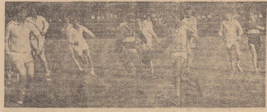
Isti disputa tricourile de campioni echipele finaliste ale campionatului de rugby Interclase organizat la Liceul „Aurel Vlaicu” din Capitala

Dupa-amiază caldă de iunie, cu soare picurind stropi de aur. „Parcul Copilului”, leagănuș al tinerii generatii de rugbyști bucureșteni are din nou oaspeții. Tribuna stadiului sint pline, ca la o mare confruntare între două formații celebre. Spectatori, in majoritate elevi. Descățăm pe matricolă: „Liceul Aurel Vlaicu”. Pe teren două echipe de „puști” minuscule cu agilitate balonului oval.