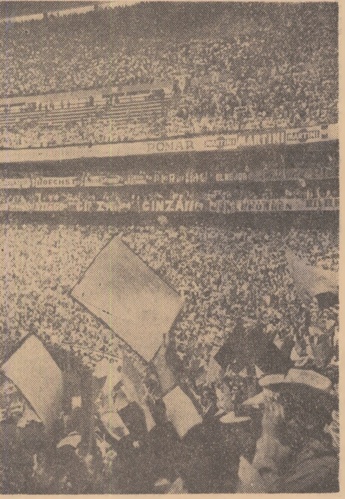
Chișul viu al stadionului „Azteca“ în zilele jocurilor lui El Mundial.