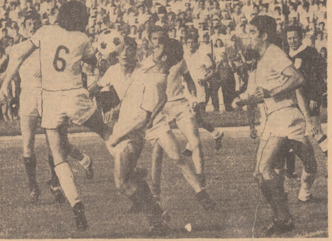
Dinu (6), cel mai bătăios dinamovist în meciul cu Farul, surprins într-un moment caracteristic, cînd încearcă să depășească un adevărat zid format din cinci apărători conștanțeni.

argheziană dintre „sufletul tău și Oceanul Atlantic“, fantezie-limită care-ți aduce zîmbetul pe buze. În fotbal, însă, fanteziile nu au limită, sfîrșimînd orice norme și judecăți prestabilite. Nu-i mai puțin adevărat că aceste „fantezii“ a- Marius POPESCU (Continuare în pag. a 3-a)