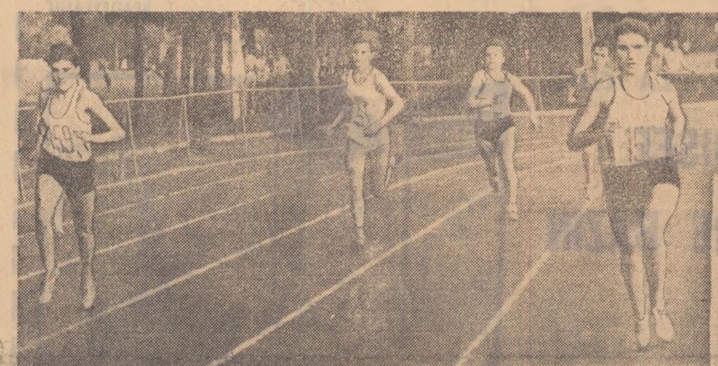
Aspect din desfășurarea probei de 800 m.

În calendarul competițional internațional al ciclismului de pistă românesc și-a făcut loc o nouă întrecere: „CUPA ZIARULUI SPORTUL“. Ea debutează astăzi, la ora 16,30, pe ovalul de beton de la Dinamo, reunind la start redutabilele echipe ale R. D. GERMANIEI, BULGARIEI, UNGARIEI și ROMÂNIEI.