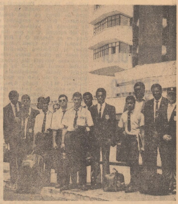
La câteva minute de la sosire, boxerii americani „pozează“ fotoreporterului nostru, Vasile Bageac