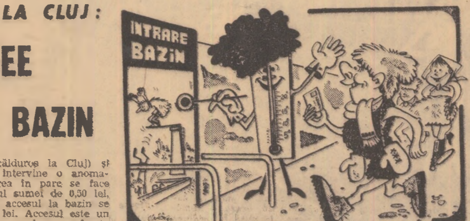
Termometrul: Așa da! Poștiți! Desen de Al. Clenci

BIRLAD - Zilele trecute a fost inaugurat noul strand. Baza sportivă, situată într-un loc pitoresc, în parcul sportiv și de agrement, are două bazine, unul de 50x22 m, iar celălalt de 22x7 m.