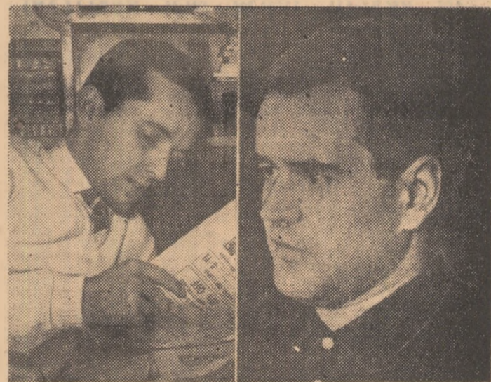
Marit maeștri Florin Gheorghiu și Milan Matulovici se întîlnesc din nou, la prima masă a meciului de șah România-Iugoslavia. (Citit în pag. a 4-a un comentariu după „turneul de la Skoplje“)

tare care găzduiește acest palpitant duel șahist.