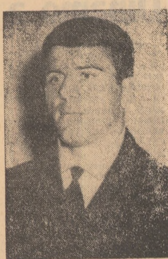
Joi, în jurul orei 13, sosește la aeroportul internațional Otopeni delegația luptătorilor români (grecu-romani și libere) care au participat la „mondialele” din Canada.