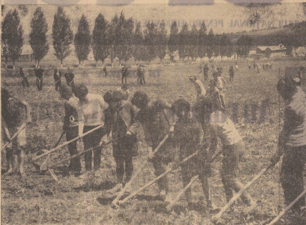
Elevii liceului din Miercurea Sibiului, în tabăra de muncă patriotică, lucrează la cultura de porumb a I.A.S. Apoldu

Asadar, notele (punctajul) obținute la proba de stand s-au cumulat astăzi cu cele realizate de aeromodeliștii în zborul practic. Întrecerea a fost rezervată lansării machetelor de avioane stră-