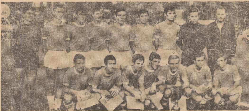
Metalurgiștii bucureșteni — la câteva momente după primirea trofeului Cronica în pag. a 2-a