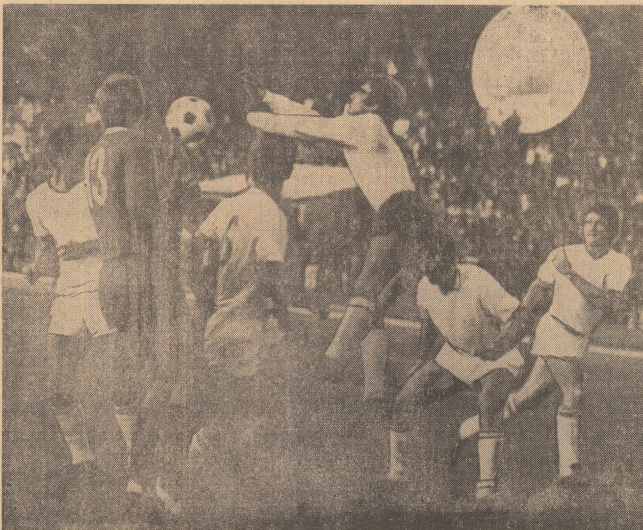
Grămadă deschisă la poarta ieșenilor