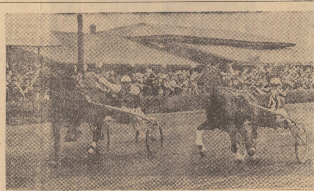
Aspect de la Derbyul de trap