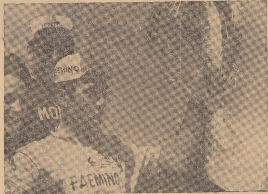
Merckx, supercampionul pedalei, savurîndu-și triumful...