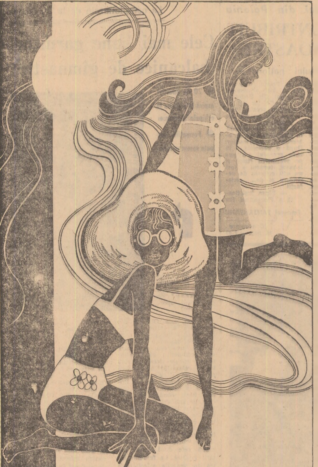
Faceți o sărbătoare din concediul dv. pe litoral alegînd modele noi și elegante de confecții pentru plajă!

Biletele pentru finala Cupei României la fotbal dintre echipele Steaua — Dinamo București ce se va desfășura duminică 26 iulie a.c. pe stadionul „23 August”, se pun în vînzare începînd din ziua de 23 iulie la casele obișnuite. Sînt valabile biletele cu seria 36.