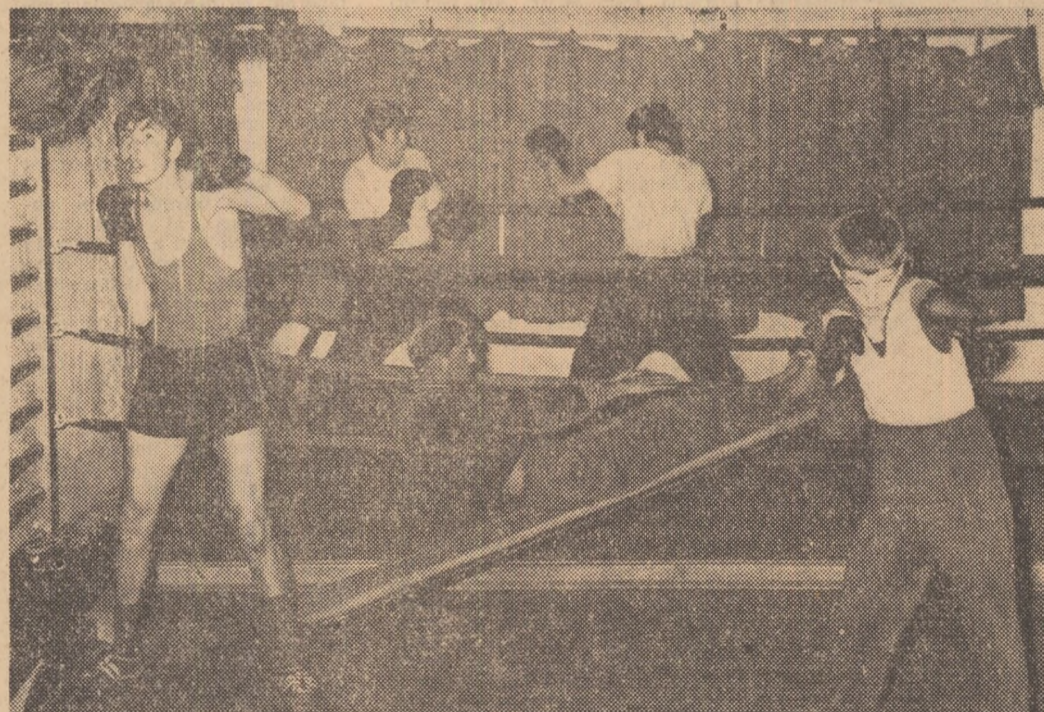
„Piecăruta ce-i trebuie, pare să spună această imagine surprinsă în sala Clubului Sportiv Școlar”