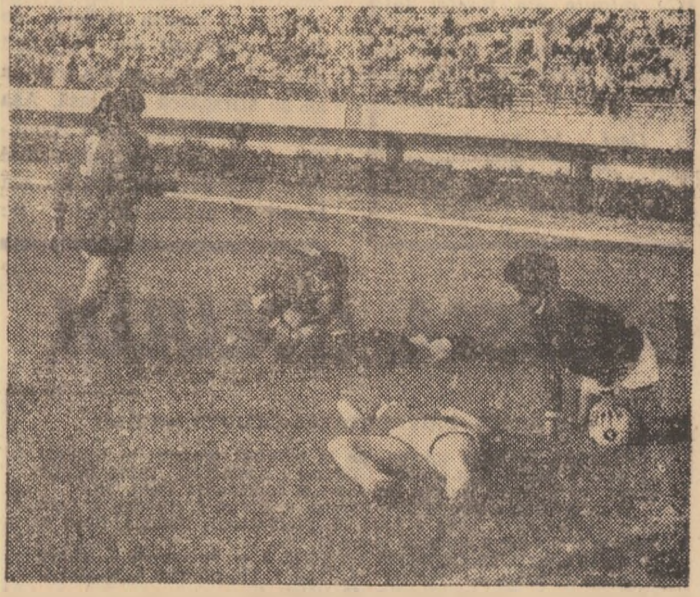
Odihnă în timpul meciului? Nu! Urmarea unor faulturi, în semifinala dintre Italia și Mexic, nu se poate spune că acest meci a fost „de domoșoare“

După pregătirea tehnică a jucătoarelor însă încă de dorit (în special în jocul cu capul), în schimb, condiția fizică și jocul athletic (!) au fost la înălțime. Danezele au devenit campioane mondiale în fața Italiei (cea mai tehnică formație) în special da-