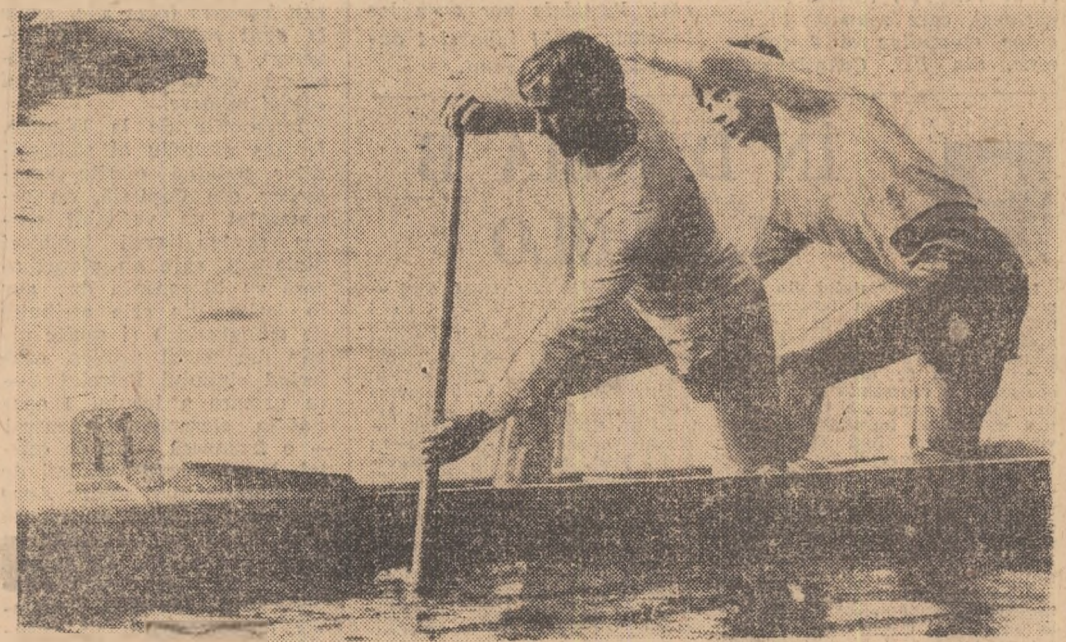
Serghei Covaliov și I. Patzaichin, „dublu” multor speranțe pentru proba de canoe dublu 1000 m.

Asadar, de data aceasta — mai puține nume cu rezonanță în caiac și canoe, pe plan internațional, binciteles cu cîteva excepții — prima fiind prezența valorosului dublu A. Vernescu — A. Scioteic, secondată (în ciuda diferenței mari de vîrstă) de cea a canoistilor I. Patzaichin și S. Covaliov, campionii olimpici de la Nochimilco.