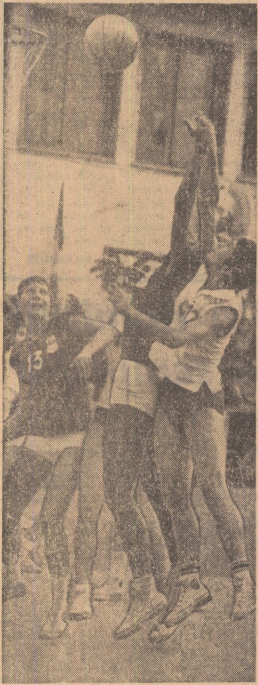
Dispută sub panou în meciul dintre Polonia și Franța