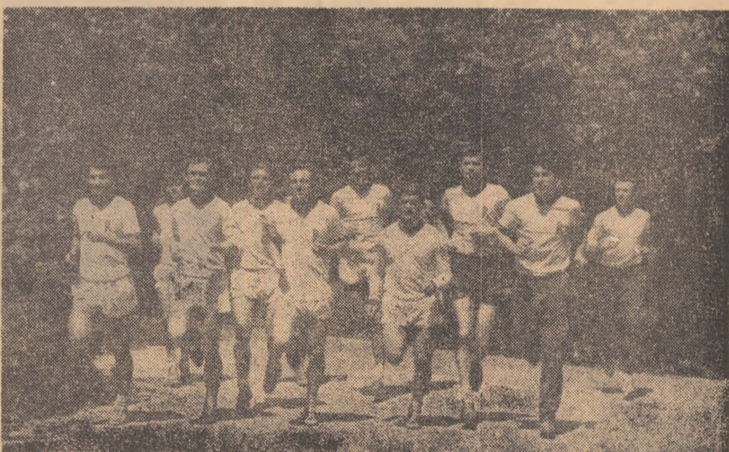
Rapidistii la „lucru”: cros în pădurea Băneasa.

Se pare că Dumitrescu nu va face deplasarea, avînd de susținut examenul de bacalaureat.