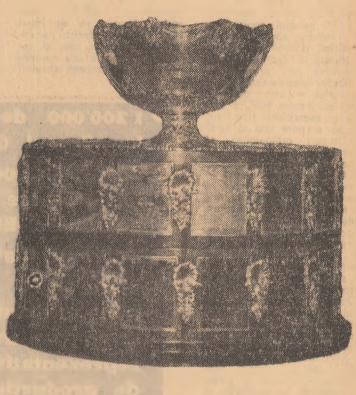
Pe acest soclu, impresionant ca dimensiuni, al faimosului trofeu, sunt înscrise participanții — învingători și învinși — la cele 59 de finale disputate în „Cupa Davis“, de la fondare (1900) și până azi. Pe a 58-a placă de argint s-au gravat și numele sportivilor României, finalisti edii de anul trecut.

cheamă aduceri aminte emoționante. Acum un an, pe același teren betonat, dădeau luptă grea, cu adversari puternici și condiții neobișnuite de joc pentru ei, tenacii noștri Ion Tiriac și Ilie Năstase.