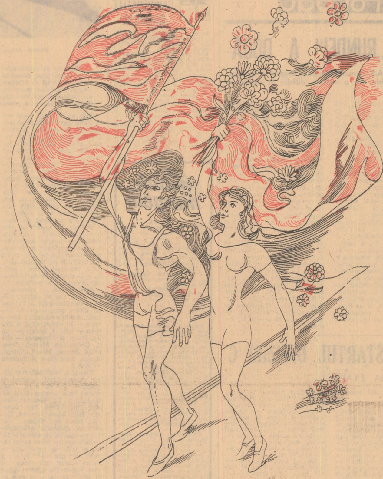
Desen de TEODOR BOGOI