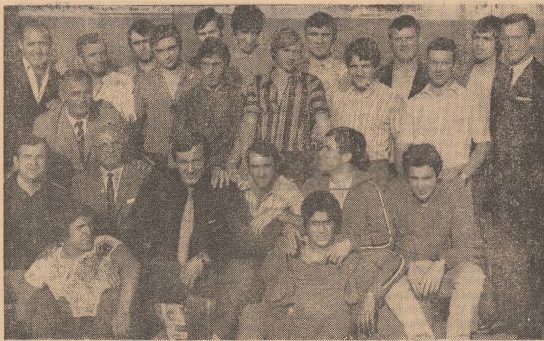
Rugbiștii de la Tarbes, imediat după sosirea lor pe aeroportul internațional Otopeni.