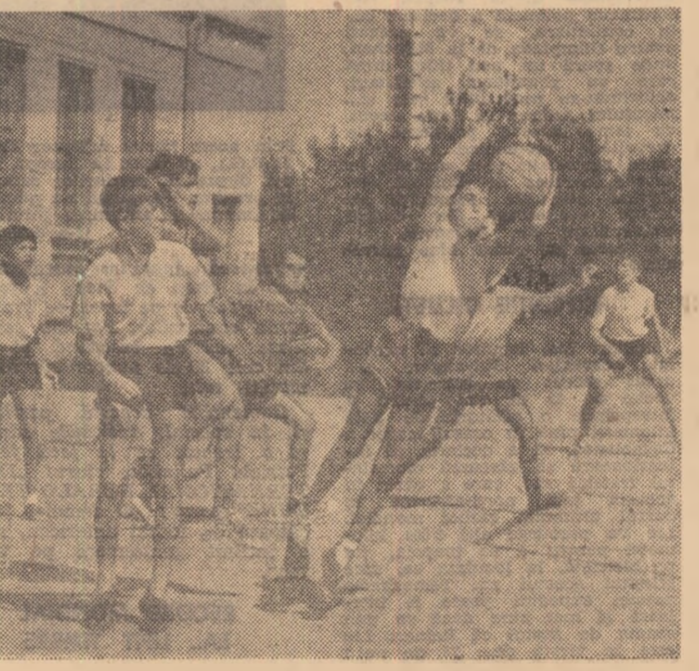
Ce înseamnă să-ți permiți regulamentul, numai te, să folosești și mințile, în lupta pentru posesia balonului. Micii fotbalisti privesc cu neacaz spre portarul care le va „sufla” mingea. Și ce bine venise centrarea!