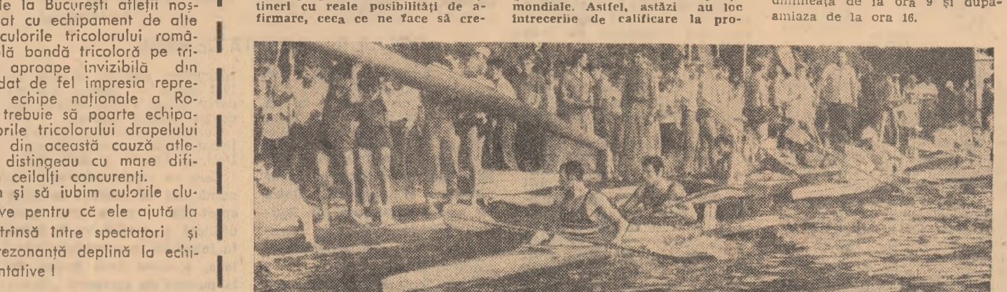
Febra dinaintea startului...

dem că în foarte multe finale va fi extrem de dificil de anticipat ordinea clasamentului. Reține atenția și noua formație de organizare a finalelor din acest an, în concordanță cu programul vîltoarelor competiții mondiale. Astfel, astăzi au loc întrecerile de calificare la probele olimpice, mine se vor disputa semifinalele și finalele acestor probe, iar sîmbătă semifinalele și finalele celorlalte probe. Întrecerile sînt programate dimineața de la ora 9 și după-amiaza de la ora 16.