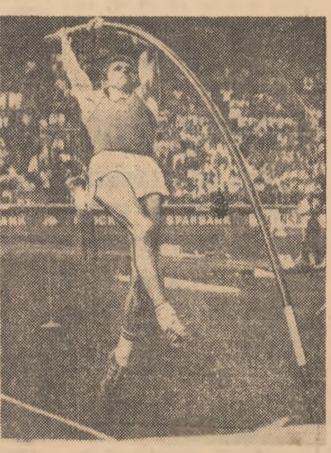
Sub brațele viguroase ale lui WOLFGANG NORDWIG, prăjina de plastic se îndoaie ca un arc. Peste cîteva clipe, ea îl va propulsa pe săritor peste ștacheta recordului lumii.