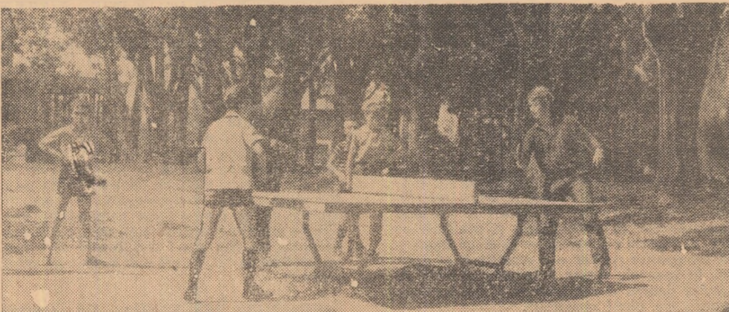
Elevii din Miercurea Ciuc au avut o vacanță plină de bucurii. Pentru ei s-au amenajat, în incinta școlii, terenuri de joc de dîmbru, biliard și tenis din beton. La orice oră din zi, copiii de toate vîrstele înceingau, precum se vede în fotografie, aprige discuții. Ce surprize sportive le vor rezerva conducerea școlii lor pentru prima zi de curs ?

Un teren accidentat, la nivelul careu de muncă patriotică de către salariații și elevii școlii profesionale M.I.U., a fost transformat într-un minicomplex, ce urmează a fi