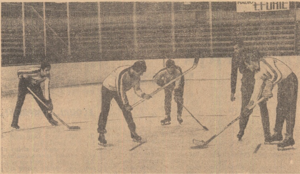
Mal repede decît ar fi fost de bănuț, crusta de gheață albă s-a asternut pe patul de beton al patinoarului „23 August” din Capitală. Fotoreporterul nostru a surprins un moment de angajament din „Joaca” de ieri dimineață a hocheiștilor de la Steaua. El își vor începe însă antrenamentele în mod serios abia azi. Amănunte despre aceste lucruri și despre deschiderea patinoarului puteți citi în pag. a II-a.