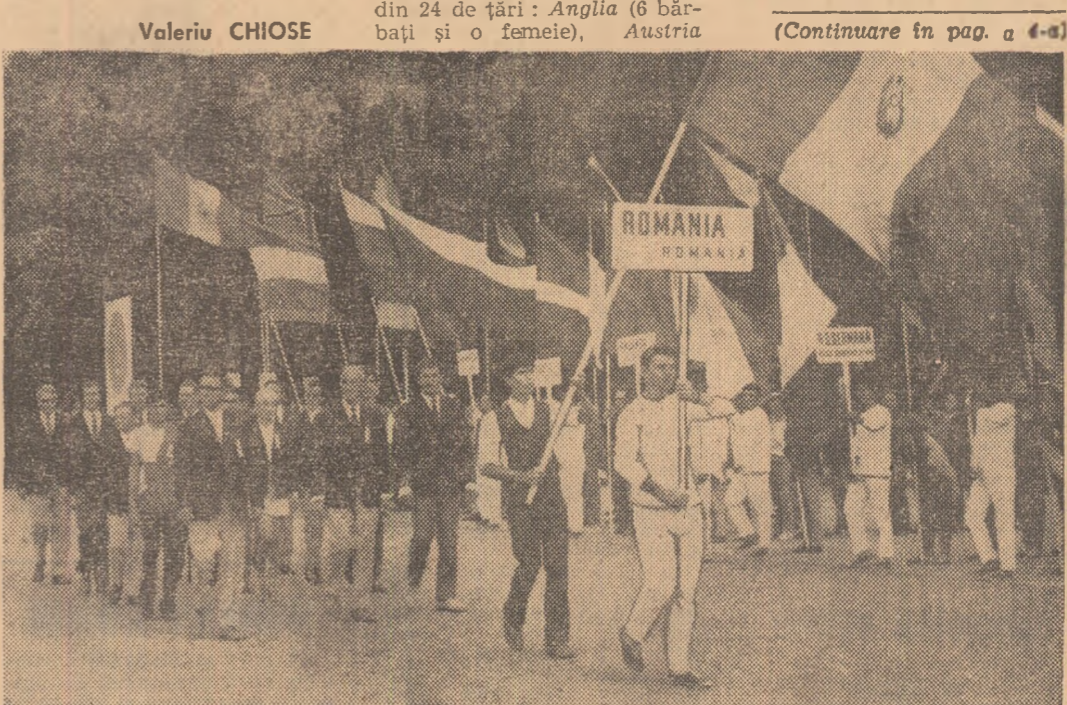
Festivitatea de deschidere a „euro penelor”. În prim plan, echipele României