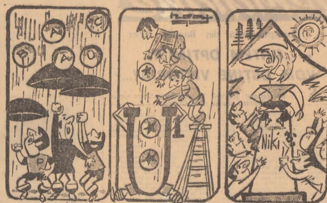
Cînd „plouă” la Bacău... „Stelștii” încarcă coșul Universității. Proiect de monument la poalele Timpei