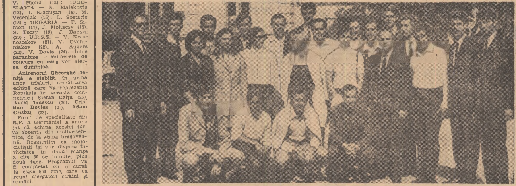
Reprezentativa de scrimă a României, cu puțin timp înainte de plecarea la mondialul de la Ankara.

Citiți în pag. a 4-a, relatarea trimisului nostru special la această competiție.