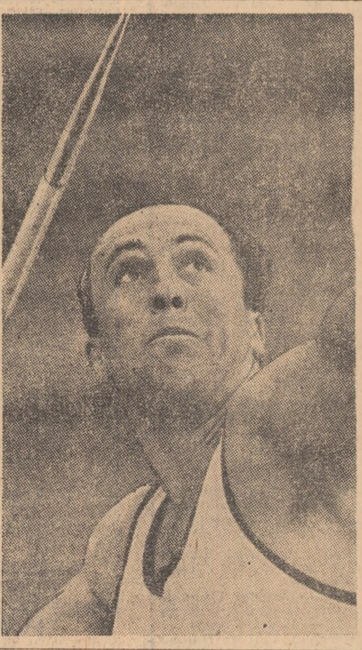
Ieri, la Paris

16,45: 1 800 m (b) 17,00: 5 000 m, suliță (f), greutate (f) 17,20: 400 m garduri — finală 17,30: 200 m (f) — finală 17,40: 200 m (b) — finală 17,50: 400 m (f) — finală 18,00: 4x100 m (f) 18,10: Festivitatea de încheiere