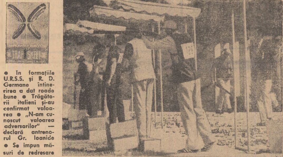
Pe standuri, tîntășii aflați în întrecere într-o nouă serie.

• In formațiile U.R.S.S. și R. D. Germane întinereau a dat roada bune • Trăgătorii italieni și-au confirmat valoarea • „N-am cunoscut valoarea adversarilor” — declară antrenorul Gr. Ioanide • Se impun măsuri de redresare în tirul nostru la talere.