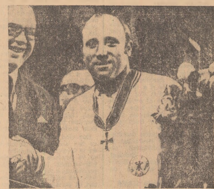
Înaintea ultimului său meci, UWE SEELER a primit o înaltă distincție din partea reprezentativului guvernului federal, secretarul de stat W. DORN.

★ Din cauza orei târzii la care se desfășoară meciul România — Iugoslavia, nu-i vom putea publica rezultatul decît în numărul de mine al ziarului.