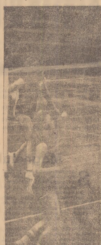
Înaintea plecării la „mondiale”, fetele noastre s-au pregătit cu asiduitate pentru a avea o comportare cât mai bună.