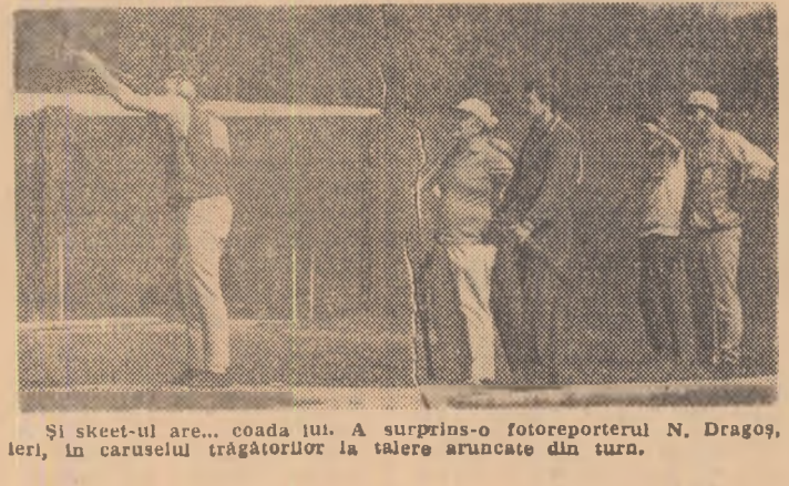
Și skeet-ul are... coada lui. A surprins-o fotoreporterul N. Dragoș, ieri, în carucelul trăgătorilor la talere aruncate din turn.

C. COMARNISCHI (Continuare în pag. a 4-a)