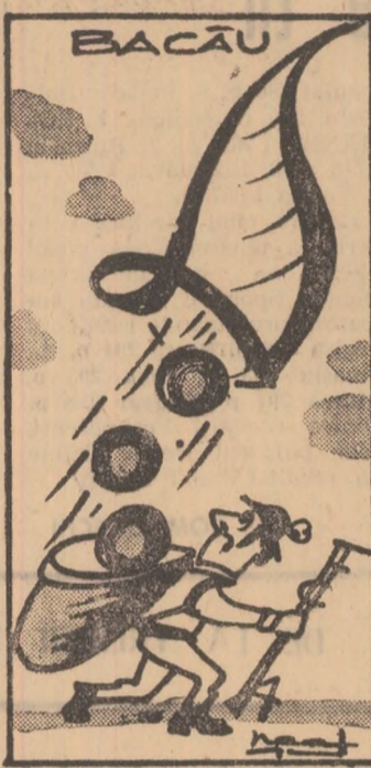
Cornul abundenței continuă...