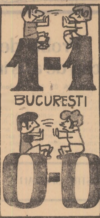
Pumnareta, pumna tii