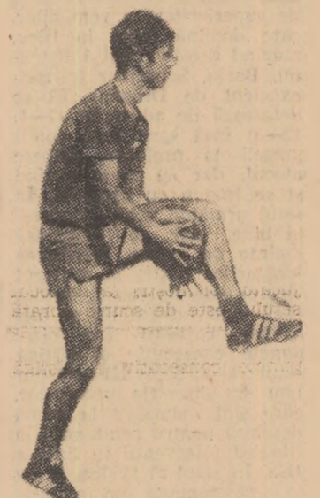
fiu inclus în echipă și cu două zile înainte să-și „sară” un mușchi sau să fi se întîmple „mai știu eu ce...”