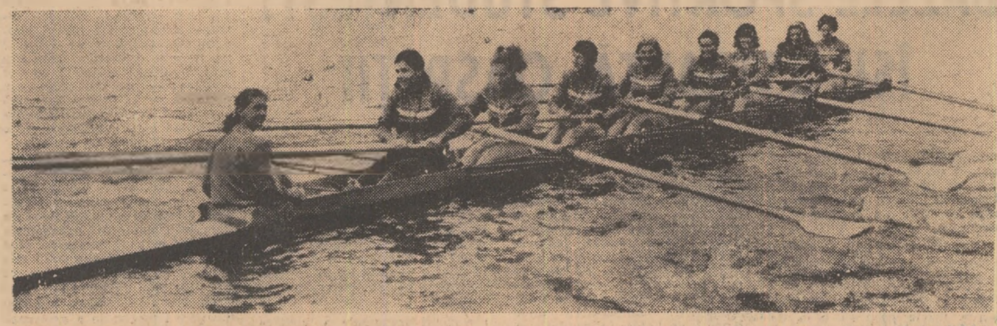
Schifistele „optului” C.N.U., campioane naționale.