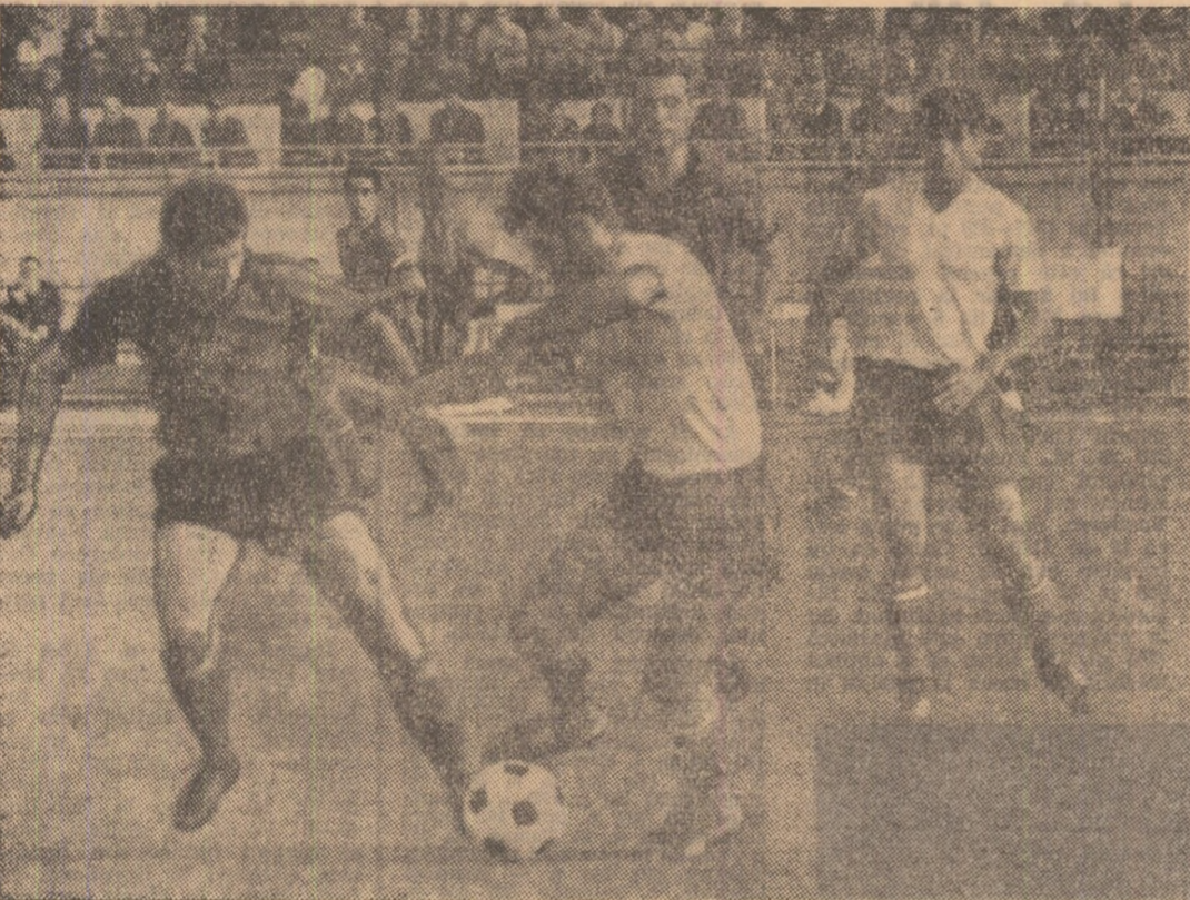
Și această acțiunea ofensivă a jucătorilor noștri (în tricouri albe) va fi stopată de fotbalistii bulgari. (Fază din meciul Lotul de tineret — Botev Vrața)

Dacă la o primă verificare, unde, desigur, primează caracterul de trial, nu puteam pretinde formații reprezentative de tineret omogenitate, antrenorii pot emite, în schimb, pretenții ca jucătorii convocati la lot să evolueze, cel puțin, la nivelul arătat la acest început de campionat. Parcurgind însă