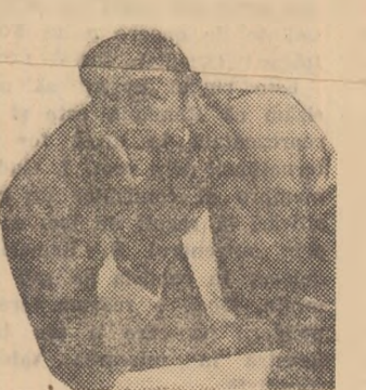
ERNST HAPPEL răspunde ziaristilor.

va constitui cel mai mare eșec din cariera dv. — Am avut alțtea eșecuri și alțtea succese în viața mea încit e greu să mă decid care