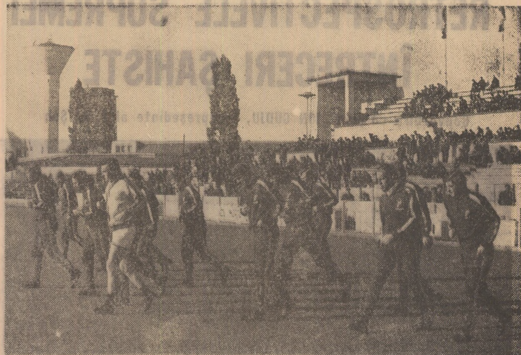
Antrenament cu public; Feijenoord face cunoștință cu stadionul U.T.A.