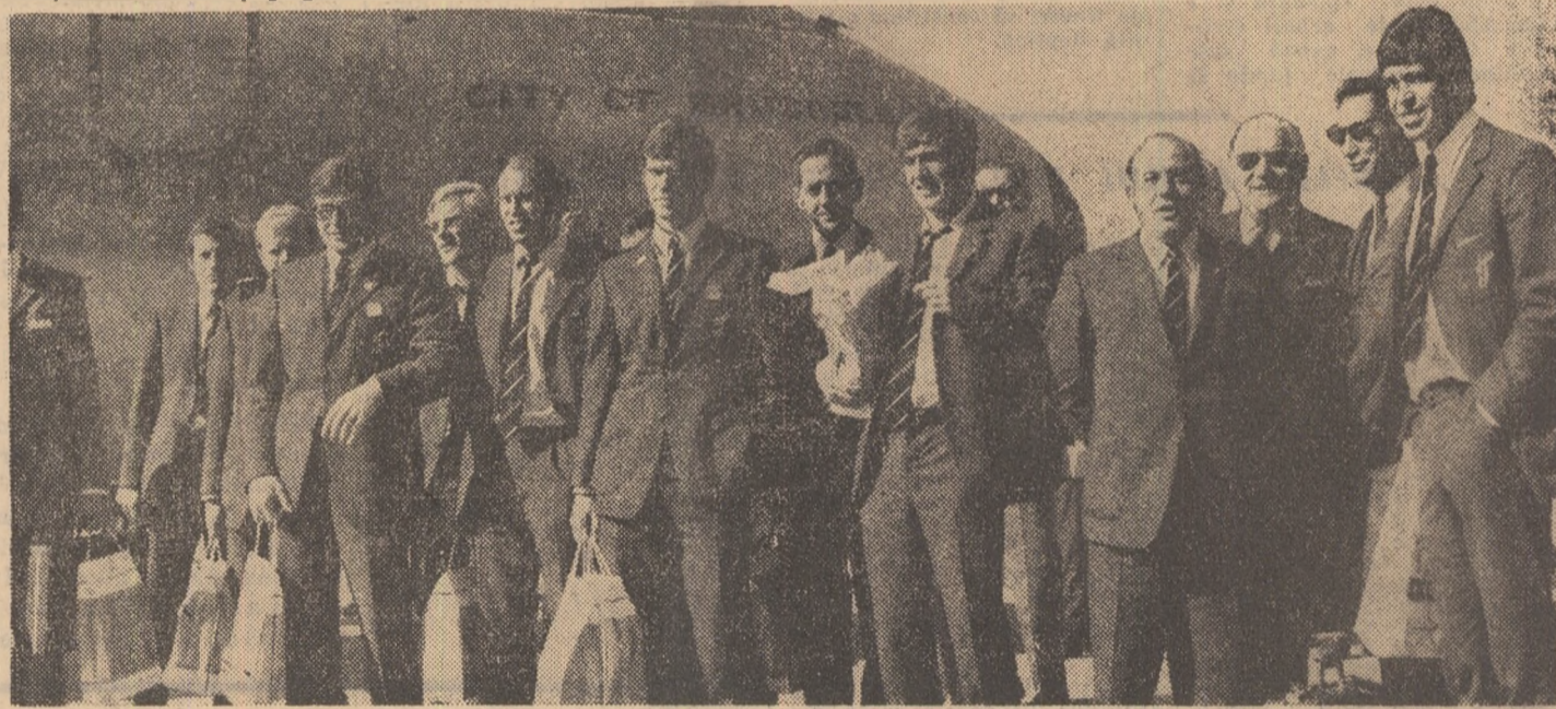
Poză de grup a fotbalistilor olandezi la cîteva minute după aterizare.