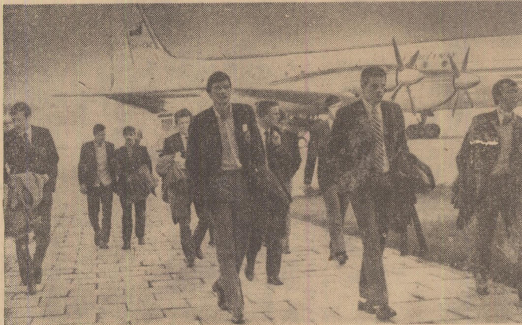
Fotbaliștii finlandezi la câteva minute după aterizarea avionului de Praga.