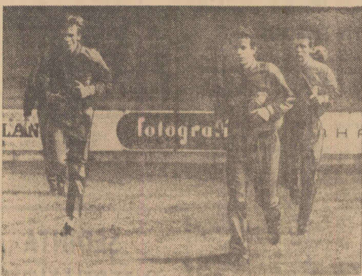
Fotbaliștii finlandezi surprinși de obiectiv la antrenament, pe stadionul din Praga.

afacurile lor sînt de o simplitate evidentă, dar periculoase. Această echipă trebuie privită cu toată atenția”.