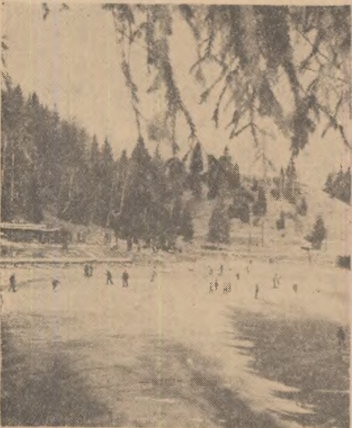
Poiana Brașov — stațiunea de sporturi de iarnă de la poalele Postăvarului, în așteptarea primei zăpezi și a primilor oaspeți, iubitori ai schiului. Până atunci, se patinează...

Noi construcții. Amenajări și acțiuni ce se impun pentru pregătirea pirtiei de schi