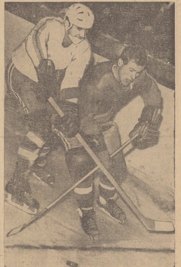
Această înclăștare la vîntinelă, între Varga și Făgăraș, simbolizează parcă marele duel pentru înțietate purtat în hocheiul românesc între Steaua și Dinamo.