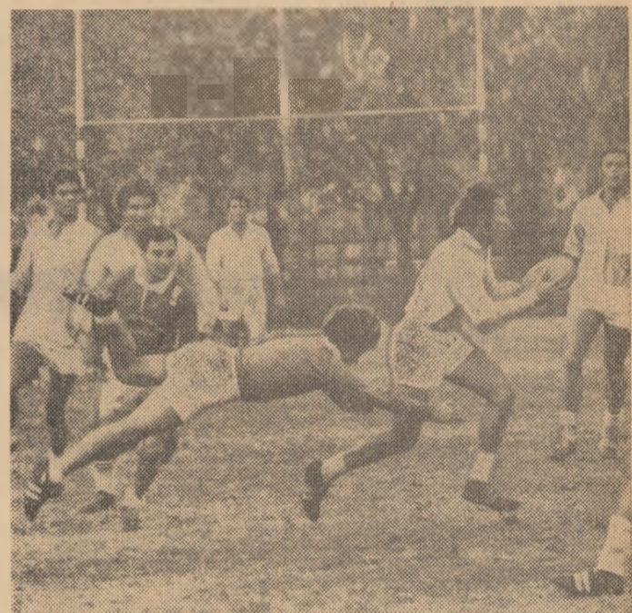
Placa curajoasă, uneori eficiente. Selecționabilii au avut ieri o remarcabilă vervă de joc, înscris — din spectaculoase acțiuni ofensive — numeroase încercări.