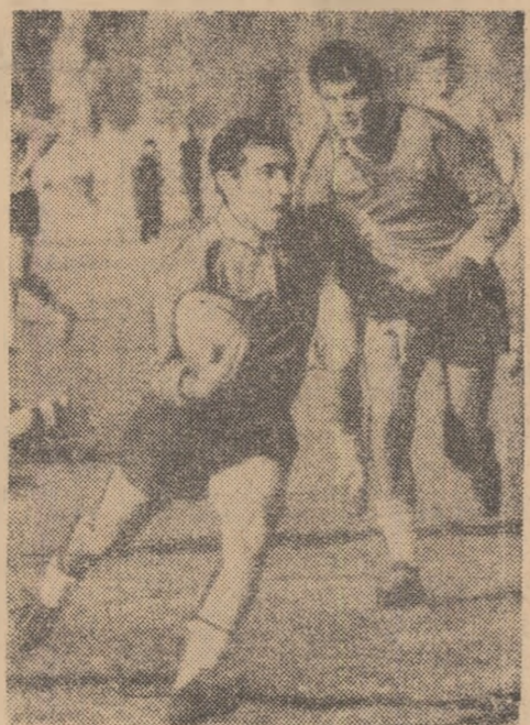
Fază din meciul Dinamo — Agronomia Cluj, câștigat de bucureșteni