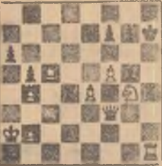
(Controlul pozitiei: Alb. Ra2, Df3, Te5, Th1, Cg4, Pp5, b4, e4, f4, Ne8, Rg7, De7, Td4, Tg4, Ng5, Pp5, b5, f7, g7).