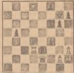
(Controlul pozitiei: Alb. Rb2, Da1, Td3, Td8, Pp4, g2, h3, Ne8, Rg7, De2, Te3, Nf3, Pp5, f4, f6, g6, h7).