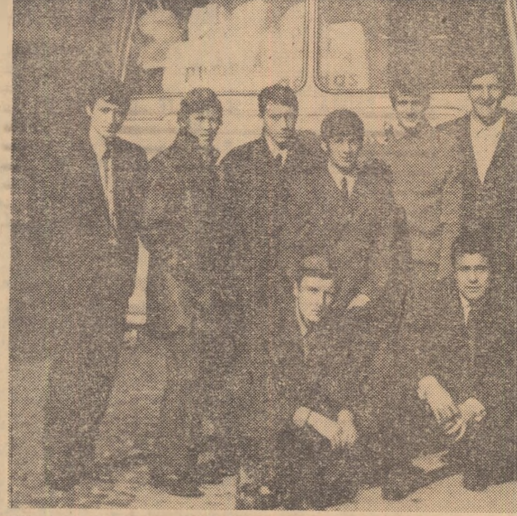
Tricolorii, înaintea plecării spre Brașov — ultima etapă a pregătirilor în vederea meciului cu fotbalistii Țării Galilor din Campionatul european.

și el indisponibil și a fost înlocuit cu Domide. De azi (nr. ieri), „campania Cardiff“ a intrat în ultima... linie dreaptă. Poiana Brașov înscamnă etapa pregătirilor în comun, care cuprind, printre altele, un meci de verificare, sîmbătă, cînd tricolorii vor primi replica echipei Steagul roșu.