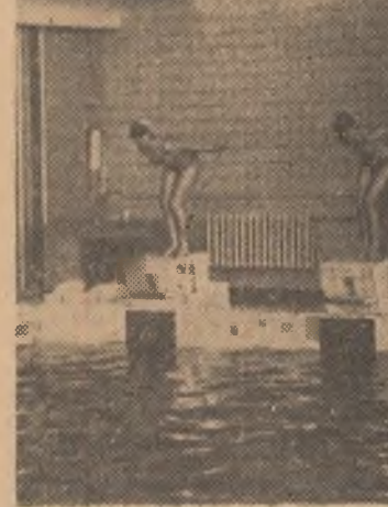
Iubitorii de frot din orașul Holmsk (U.R.S.S.) au la dispoziție, de la începutul toamnei, acest frumos bazin, care face parte dintr-un întreg complex sportiv, utilat după cele mai moderne cerințe

În turneul feminin, Françoise Durr (Franța) a dispus cu 7-5, 9-7 de Rosemary Casals (S.U.A.).