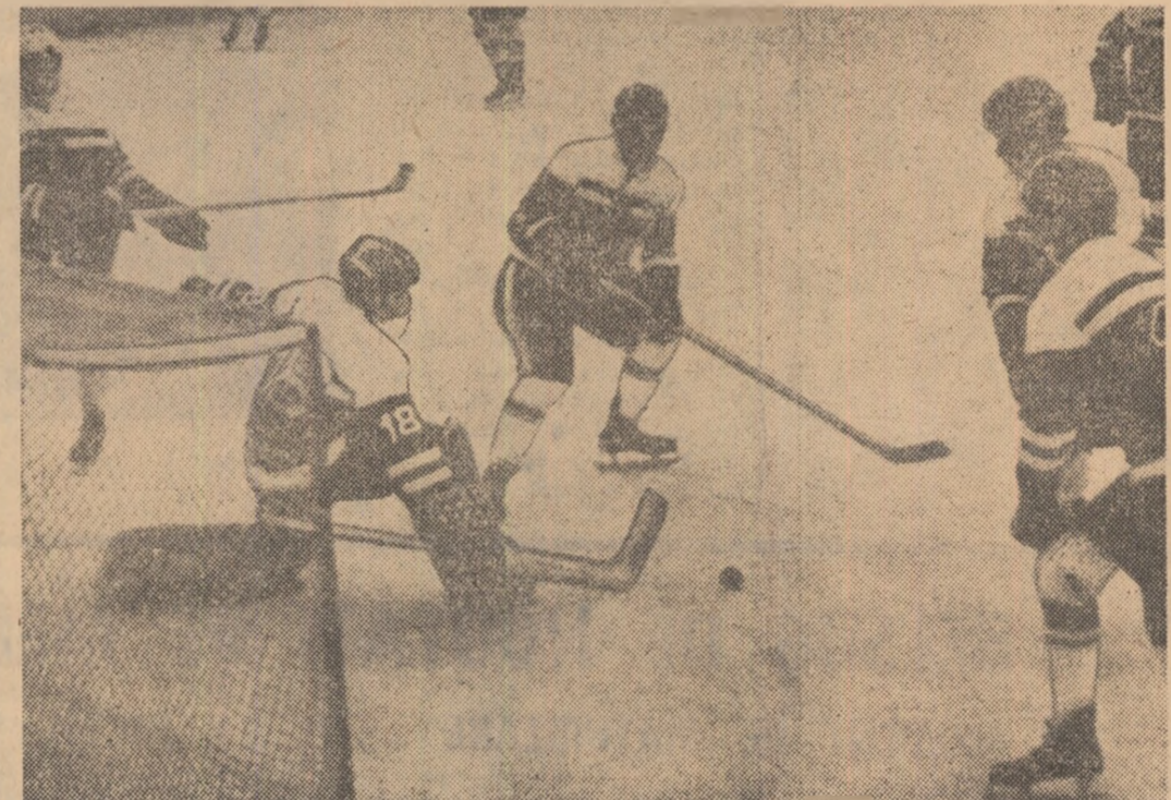
Tinerii hocheiști din echipa R.D. Germane la antrenamentul de ieri.