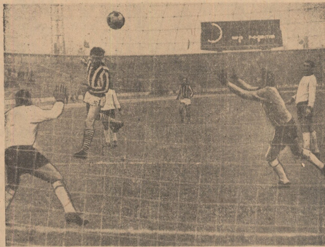
Dinu a executat o lovitură liberă, Dumitru a fișnit și a reluat cu capul imparabil. E 3-0 pentru Rapid

Recomandată de firma și faima fotbalului brazilian, orice echipă din țara cafelei găsește în România o audiență cu totul specială, publicul nostru rămânând un statornic și sensibil admirator al fotbalului creator, inventiv, spectaculos. În cazul teamului condus de celebrul Mauro, recomandările „din oficiu” îi se adăugau rezultatele favorabile (în Franța și Iugoslavia) obținute până acum de către F.C. Curitiba în turneele pe care-l întreprinde în Europa. Adăugând și știrea că partidele jucate de acest sol al fotbalului brazilian sînt transmise în direct, de posturile de radio braziliene — numim, de fapt, ultimul magnet care ne-a grăbit ieri pașii spre Stadionul Repu-