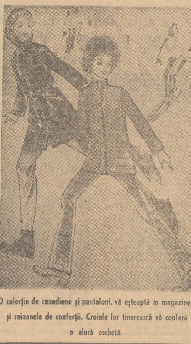
O colecție de canadiene și pantaloni, vă așteaptă în magazinele și raioanele de confecții. Croiala lor tîmearăcă vă conferă o alură cochetă.