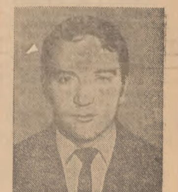
S-a datul... Cum a devenit titular, în Polonia, cum a început să creadă că fotbalul pornește și se termină cu el?