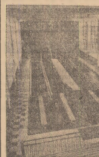
Popicria construită anul acesta, în cadrul complexului sportiv „DUNĂREA”, din Galați.

bitum, pentru volei, baschet, handbal și o tribună din beton, cu 4 rânduri de bănci; III) Liceul nr. 2 Roman (handbal, volei, baschet, plus o tribună cu scheme metalice). Mențione specială Liceul din comuna Borea (terenuri de volei și handbal, împerechute cu gardi). Frunțasele apăsătoare „competiții” și-au sîciorat o serie de premii în materiale și echipament sportiv.