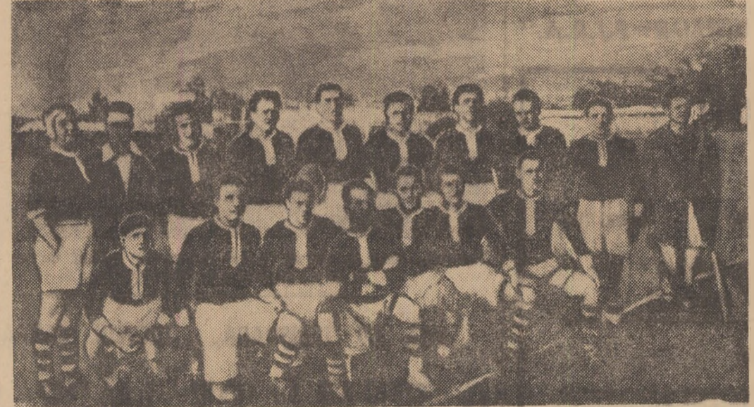
Echipa de rugby a României înaintea partidei cu Franța din 1927.