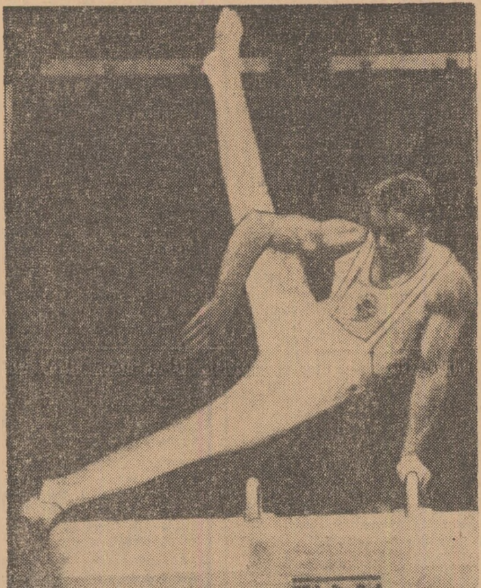
Gimnastul Miroslav Cerar, campion mondial la cal cu minere, unul din cei mai străluciți sportivi iugoslavi, crescut în anii socializării.

Pentru sportivii Iugoslaviei, anul o se încheie a fost bogat în succese. O serie întreagă de performanțe înalte și rezultate de perspectivă reflectă în mod neîndoios căsarea înaltă a sportului din țara noastră și asigurarea certă promisiuni că el va fi reprezentat cu cinste la viitoarea Olimpiadă. În sala Tivoli din Ljubljana, martoră a numeroase întreceri (hochei, patinaj, tenis de masă, lupte, gimnastică) echipele noastre au obținut medaliile de aur și argint. Organizat pentru prima oară pe continentul nostru, „Mundialul” de baschetului a prilejuit lui Daneu, Ciochi, reprezentantului Raikovici și echipierilor lor o strălucită victorie, savurată copios de întreaga opinie publică iugoslavă. Atletele Snezana Hrepevnik și Vera Nroclie, binecunoscute publicului românesc de la caracterul înalt al baschetbalistilor au schimbat veșnicile medaliile de argint în cele de aur. Organizat pentru prima oară pe continentul nostru, „Mundialul” de baschetului a prilejuit lui Daneu, Ciochi, reprezentantului Raikovici și echipierilor lor o strălucită victorie, savurată copios de întreaga opinie publică iugoslavă.