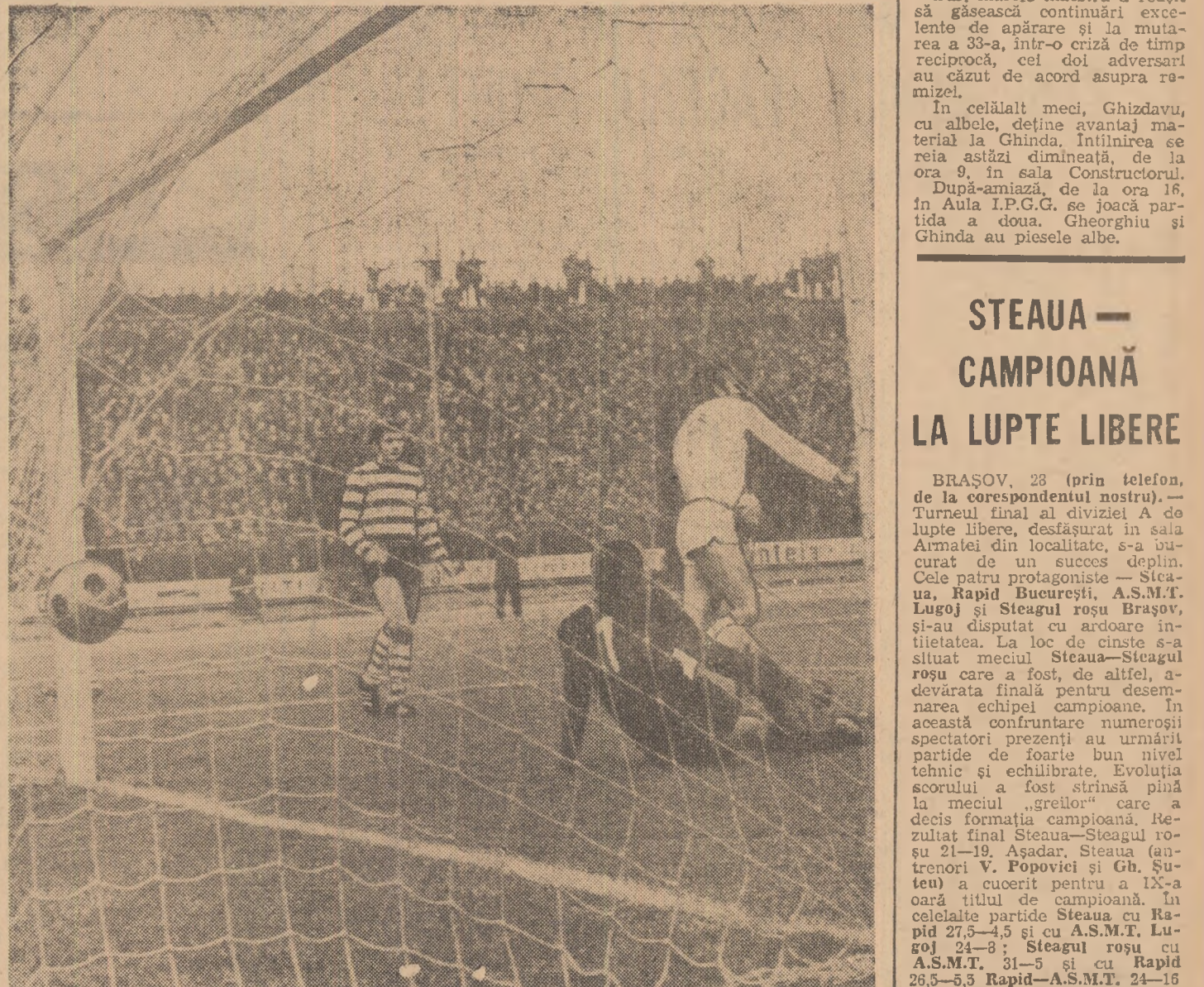
Minutul 56 al derbyului. Doru Popescu a reluat în gol-mingea scăpată de Răducanu, egalînd scorul