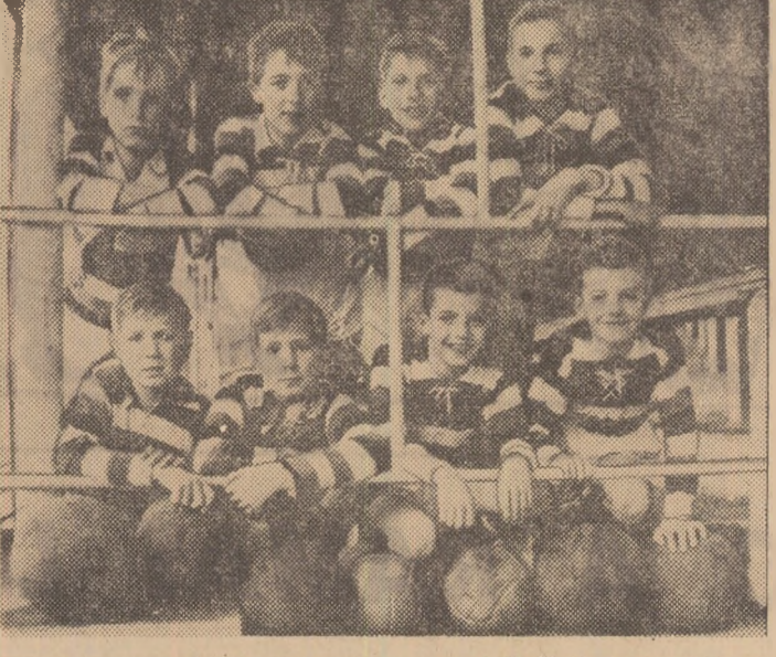
Patru perechi de gemeni = opt fotbalîști pasionați! În R.F. a Germaniei, unde a fost executată această fotografie, se cauta încă trei gemeni, pentru a se alcătui o echipă completă. Ea va fi, în primul rînd, foarte... omogenă!