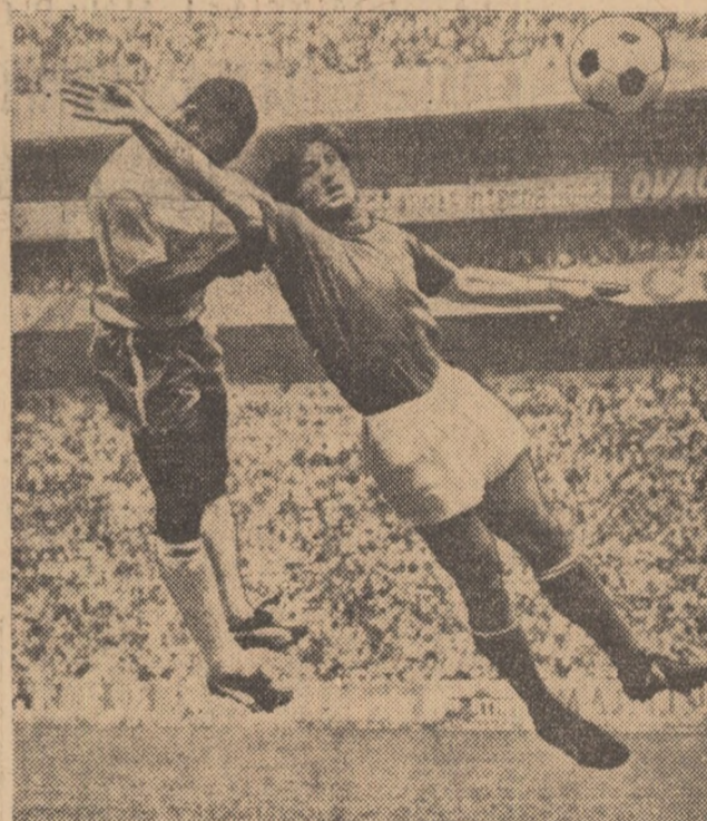
FINABA: Gentrare Rivelino, cap Pele și 1-0 pentru Brazilia..