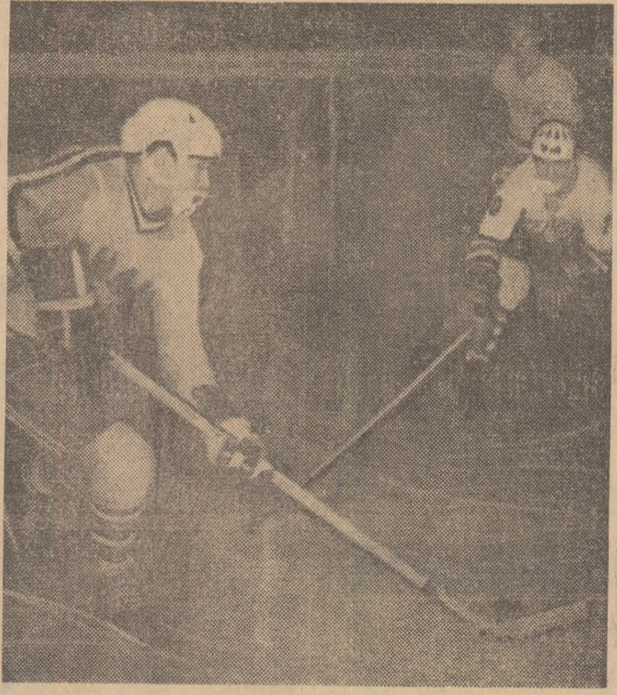
Ieri, a avut loc, pe patinoarul artificial „23 August”, prima partidă de hochei dintre selecționata României și formația secundă a Cehoslovaciei, încheiată cu victoria oaspeților 3-5 În pag. IV — cronica meciului