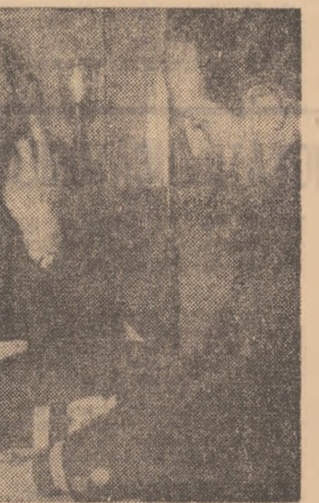
„Dacă antrenorii noștri vor folosi la maximum...”

— De loc. Și iată de ce. Întîlnirea noastră cu antrenorii de divizia A se înscrie pe linia preocupărilor federației de a îmbunătăți neîntrerupt, de echipele de club, procedee de instruire și educație. Analizăm, periodic, la sfîrșitul unor etape de muncă a fostatăta stabilită mai ușor decât lucruri: 1. UNDE SE AFLĂ SOCCERUL NOSTRU, RAPORTAT LA NIVEL INTERNAȚIONAL; 2. CE MAI AVEM DE FĂCUT PENTRU MICSORAREA DECALAJULUI EXISTENT, sau, ca să fim mai precisi, ce anume co-