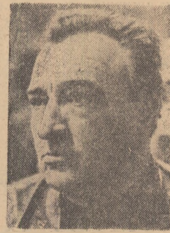
țiel, am trecut pînă acum 32 de fotbaliști.

— După cite știm, biroul federal a hotărît ca fotbalul