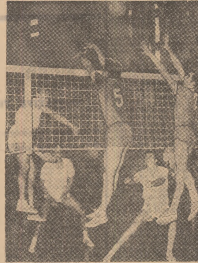
Aspect din cel mai recent meci susținut de Dinamo în Capitală. Adversar - Politehnica Timisoara. Weiss (Politehnica) trage prin blocajul dinamistilor alături de Țîrlici și Vranău.