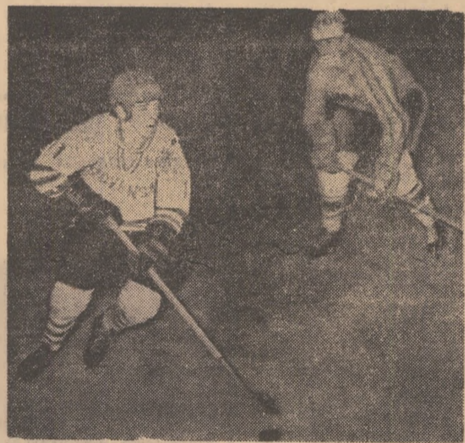
Achiziția ofensivă a jucătorilor oaspete la poarta echipei României

Dar, lipsa de experiență și momentele de pripesă ale jucătorilor noștri, comise în fața unor mari rafinați ai hocheiului, le-au îngăduit acestora din urmă să sancționeze nu sît greșelile flagrante cît, mai ales, înscuțările de joc ale reprezentativei române.