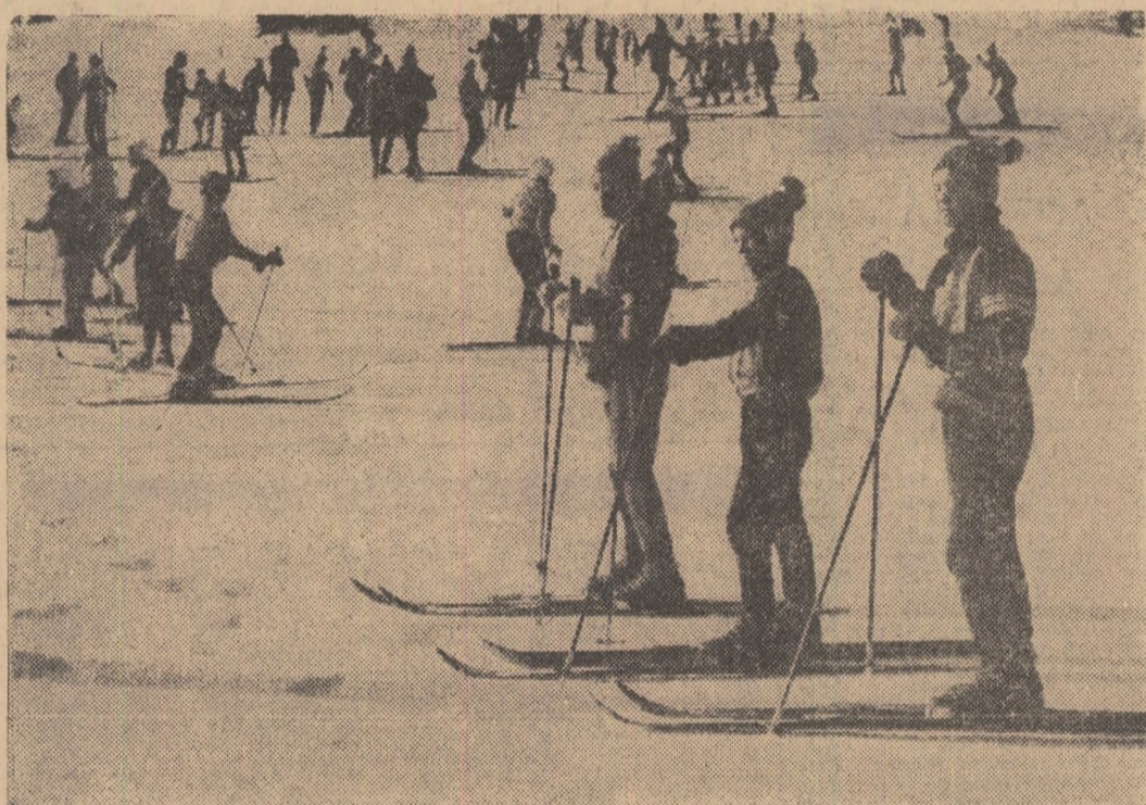
Clipe de răgaz înaintea unei noi coborâri pe schiuri