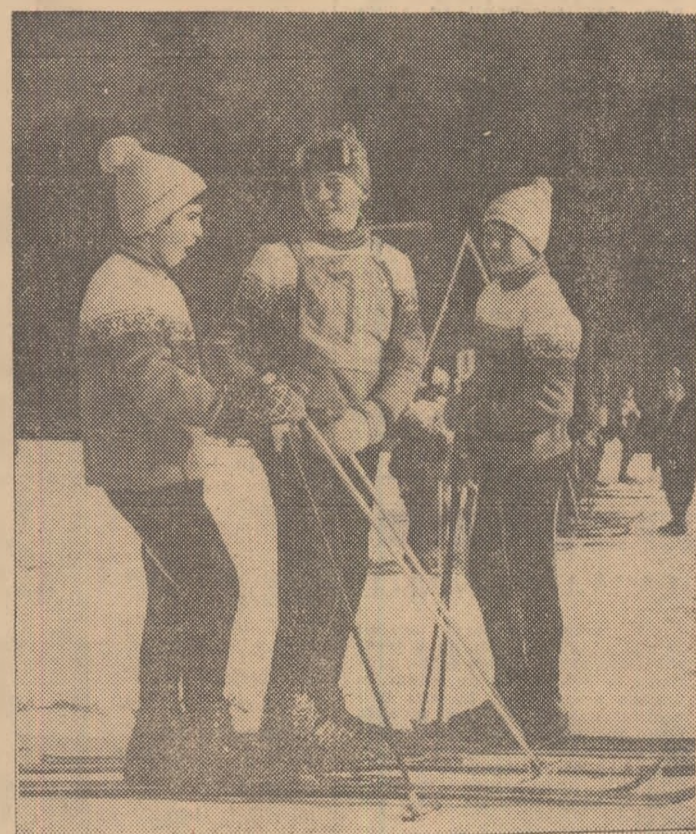
Povestind pășunile din prima manșă...