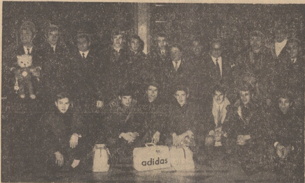
Tradiționala fotografie a echipelor ce se întorc victorioase din lotare: delegația handbaliștilor români, aseară, pe aeroportul Berlin.

● Eroul meciului de la Berlin declară: „Așadar, am avut dreptate... Ne-am luat revanșa acolo unde trebuie!”