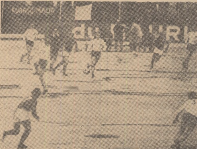
Fotbal pe zăpadă în Malta? Nu. Dimpotrivă. Duminică în orașul La Valletta termometrul a indicat aproape 20 de grade la meciul dintre Malta și Elveția (1-2). Următor nîsîps lasă impresia... zăpezii. În imagine o fază din acest meci.