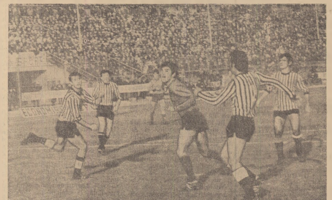
Fază din partida Steaua—Steagul roșu (1—2), un meci în care gazdele au pierdut „punctele din oficiu”