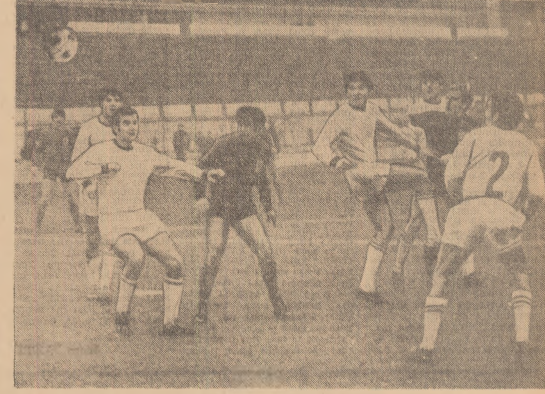
Fază din meciul Steaua — C.F.R. Timișoara. Un nou moment critic la poarta feroviarilor. Pentru retur, timișoarii își doresc cit mai puține asemenea faze.

P. BECKER: „Am intirziat cu 13 săptămîni”