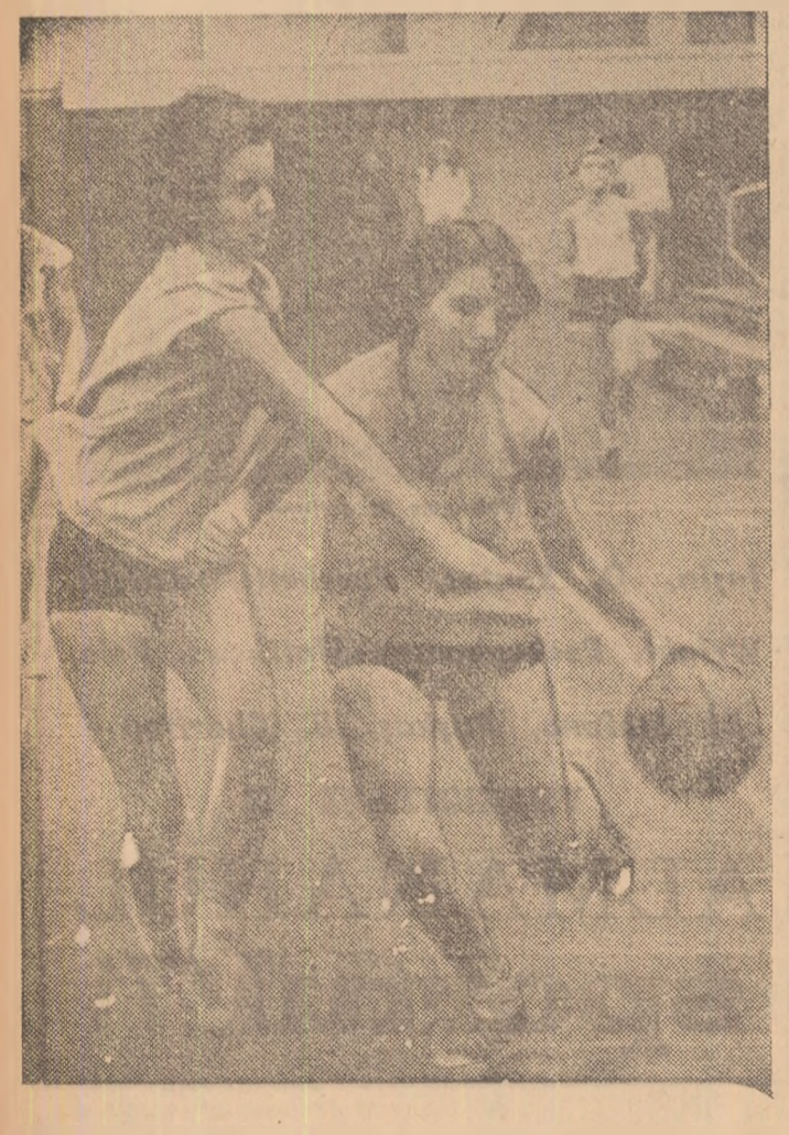
Cu prilejul premierii echipelor bucureștene calificate pentru Criteriul național...