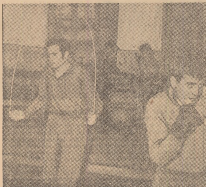
In timp ce multi dintre colegii lor stau in statiunile balneare sau climaterice la refacere...