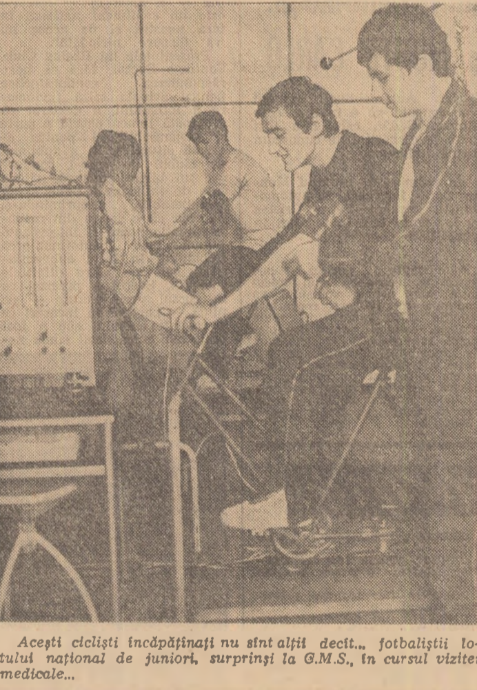
Acești cicliști încopărnăși nu sînt alții decît... fotbaliștii lotului național de juniori, surprinși la G.M.S., în cursul vizitei medicale...

Helvel, vesnicul ghinionist, cel despre care ne-a ajuns la ureche — zvon reprimat de