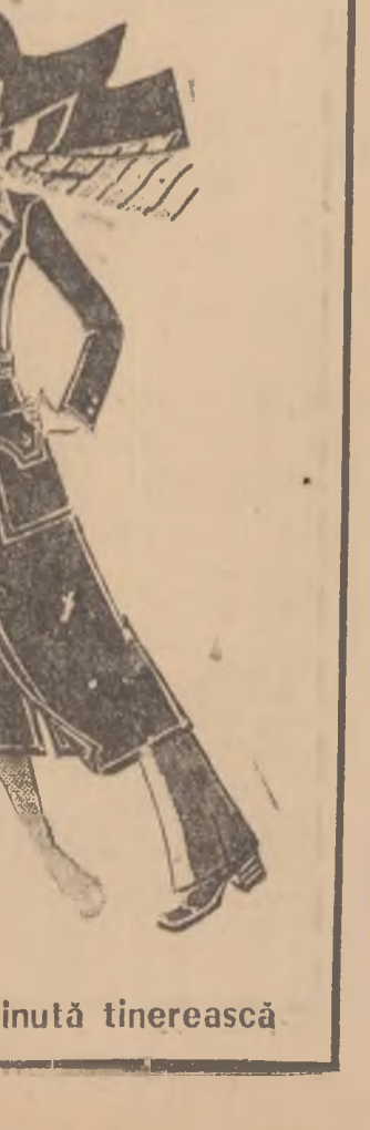
Modele care dau o ținută tinerească