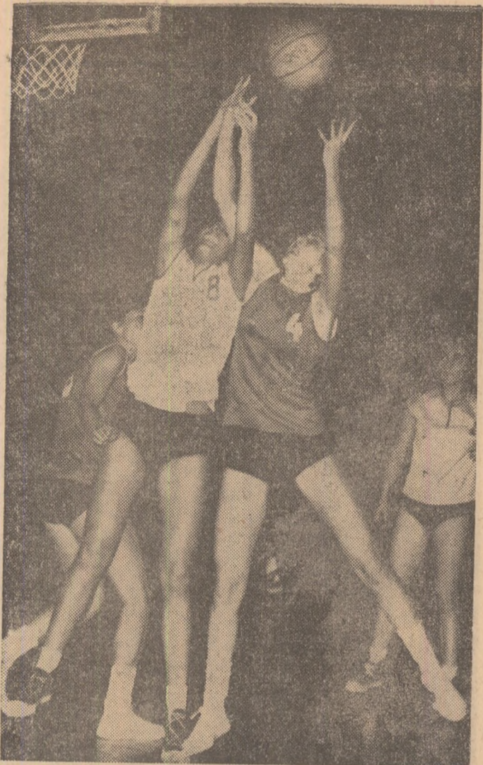
Luptă dîră sub panoul Politehnicii în dispută cu constructorul