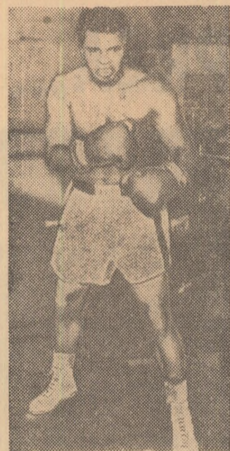
Cassius Clay, pe care revista engleză „Ring Magazine” îl consideră ca pe cel mai bun boxer al anului 1970...