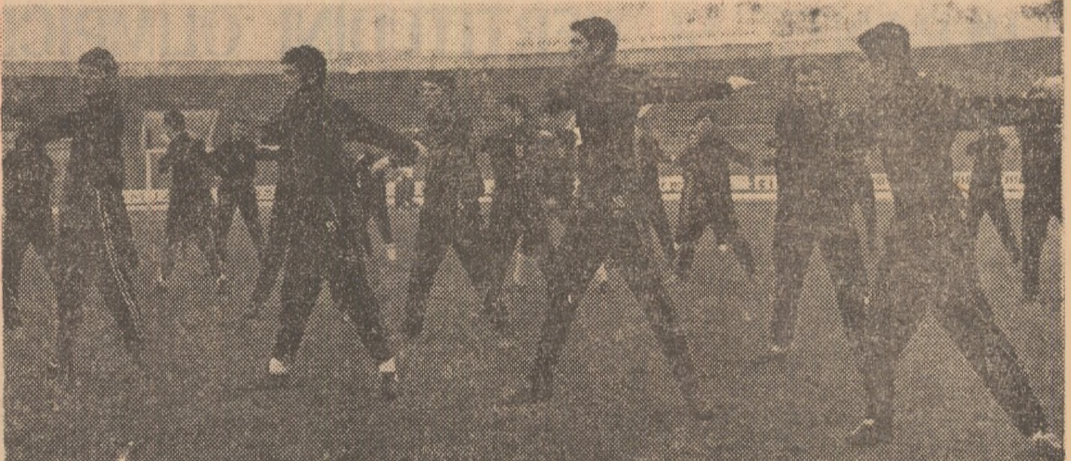
Universitarii clujești dovedesc multă ritînd în pregătire. Instantaneu luat la unu din primele antrenamente ale anului.