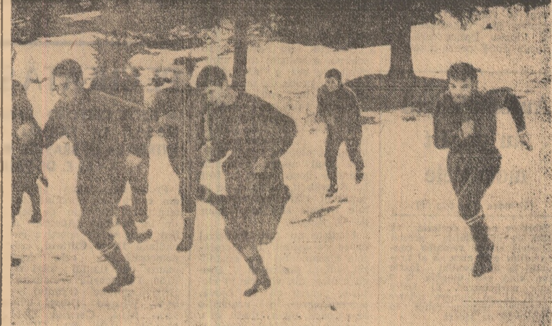
ră zilnic în localitate pînă la sfîrșitul lunii, urmînd ca apoi toți componenții lotului să se deplaseze la cabana C.F.R. Pașcani, Textila Bihuzi și Victoria Roman.

Prezent zilele trecute în stațiunea Pălținis, fotoreporterul nostru Dragoș Neagu a surprins această imagine, reprezentînd pe cîțiva din fotbalistii lui C.S.M. Sibiu, aflați în pregătire în vederea reluării campionatului. Antrenorul sibian Negru