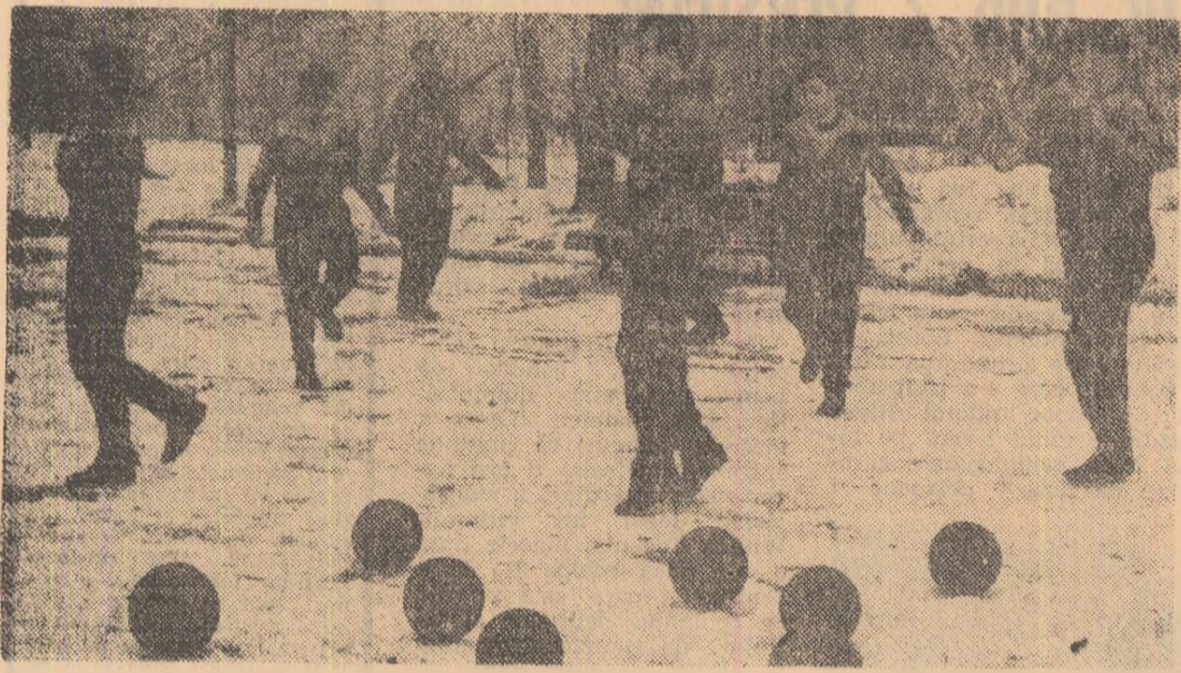
Antrenament în cori de zi, la centrul de copii și juniori „Steaua — 23 August”... Mirabile încă așteaptă, tinerii fotbalști din grupa 1953 — surprinși în imagine de fotoreporterul nostru, Vheo Macarșchi — se încălzesc, așărind corda... Peste steua minime, începe „miuța”!

Flasem — din ceea ce ne place să numim surse medicale — ca antrenamentele Centrului de copii și juniori „Steaua — 23 August” încep devreme, la ora primelor cursuri de școală, dar n-aș fi crezut că la 8 dimineața voi fi în centrul unei „miuțe” încheiate pe care antrenorul Dunga, fostul portar al Rapidului, abia reușește s-o tempereze: — Măi, Rizeșcule, măi, ce te tot duci la gol?!