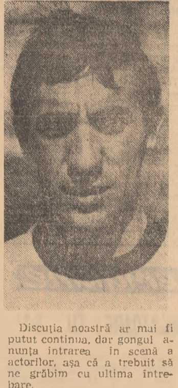
Discuția noastră ar mai fi putut continua, dar gongul anunța intrarea în scenă a actorilor, așa că a trebuit să ne grăbim cu ultima întrebare.