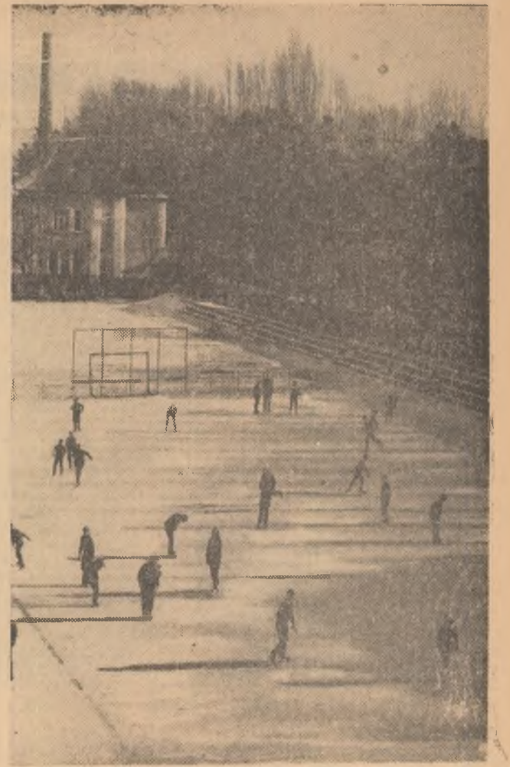
Era soare, la Sibiu, zilele trecute. Gheața patinoarului natural din curtea clubului sportiv muncitoresc începuse să se înmoaie. Totuși, copiii — mari amatori de patinaj — nu se hotărău să meargă acasă