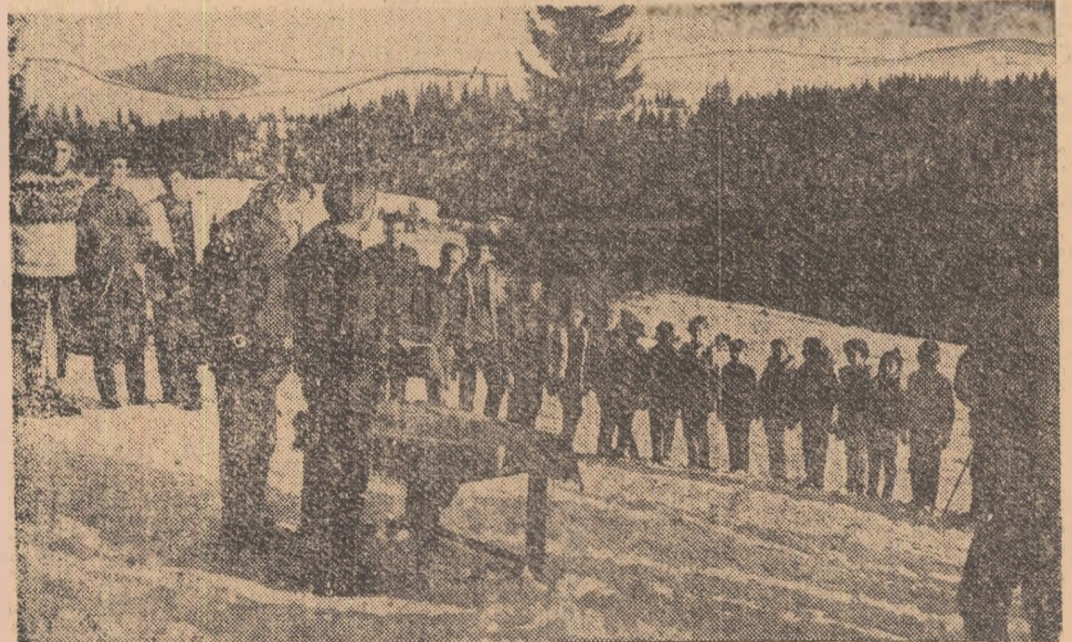
Concursurile de schi ale copiilor devin tot mai numeroase dovedind — dacă mai este nevoie — marea atracție exercitată de acest sport în lumea celor mici de la care așteptăm „narii schiorii”. Iată un aspect de la distribuirea premiilor la concursul de la Băicoșca al micilor schiori clujeni, disputat săptămîna trecut.