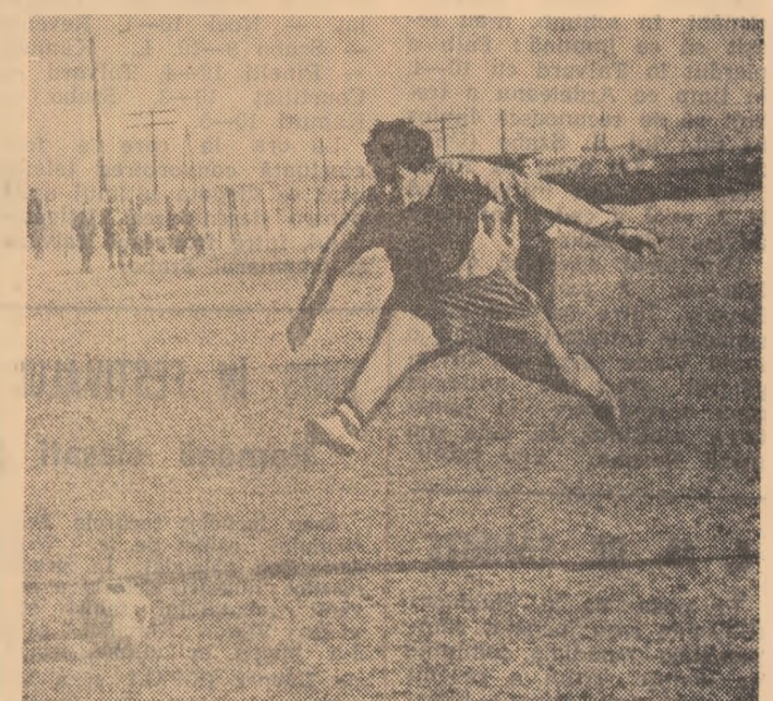
Până — într-o atitudine de balerin — șutează la poartă în timpul unui joc de verificare.

— Efectuăm zilnic cîte două antrenamente, foarte tari cu intensitate, dimineața în aer liber și după-amiaza în sală, pe care le vom continua pină la plecare în Liban. Toți jucătorii s-au încadrat foarte bine în programul stabilit și depun strădînițe meritorii. Testul Cooper, pe care l-am folosit pentru verificarea potențialului dobindît, ne-a indicat rezultate foarte bune și bune în cazul jucătorilor Elvira (11,22 pe 3.200 metri), Velcu (11,28), Băluță (11,33), Vătefu (11,57) și Nedelcu (11,58). — Care considerați că au fost principalele deficiențe ale echipei în sezonul de toamnă și ce obiective văați propus în noua calitate? — Cred că viteza de joc cam scăzută, acțiunea jucătorilor pe zone prea restrînse și nesiguranța apărării au constituit principalele carențe în evoluția echipei noastre. Bineînțeles, îmi îndrept atenția în momentul de față spre înlăturarea lor. Dorosc, de asemenea, să realizez o mai bună înțelegere și colaborare între ju-