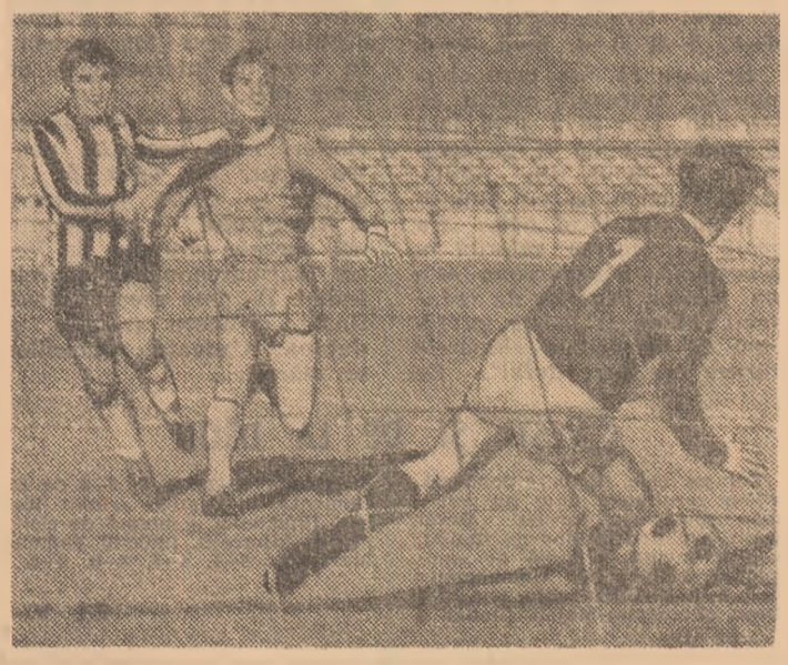
Doi din protagoniștele campionatului de tineret-rezerve: Dinamo și Universitatea Cluj, față în față într-un meci spectaculos. Păcat că tribunele au fost aproape goale.