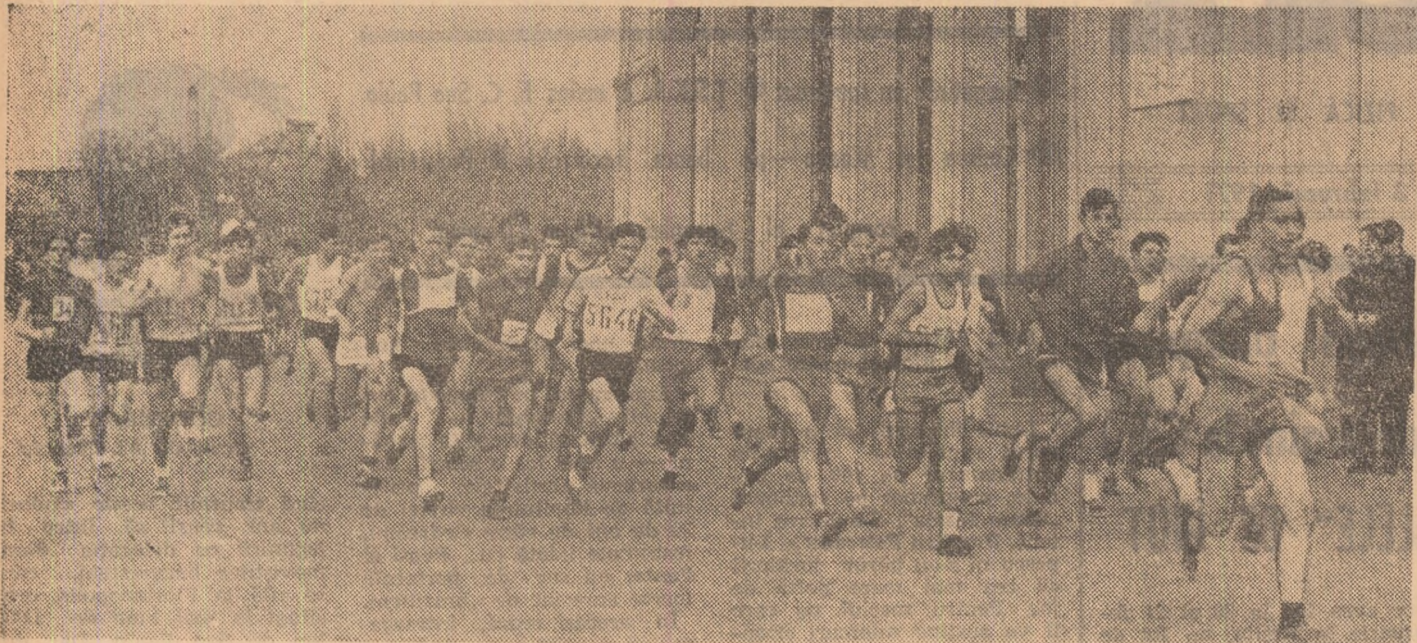
Aspect din cadrul competiției de cros organizată de S.S.A. din București.