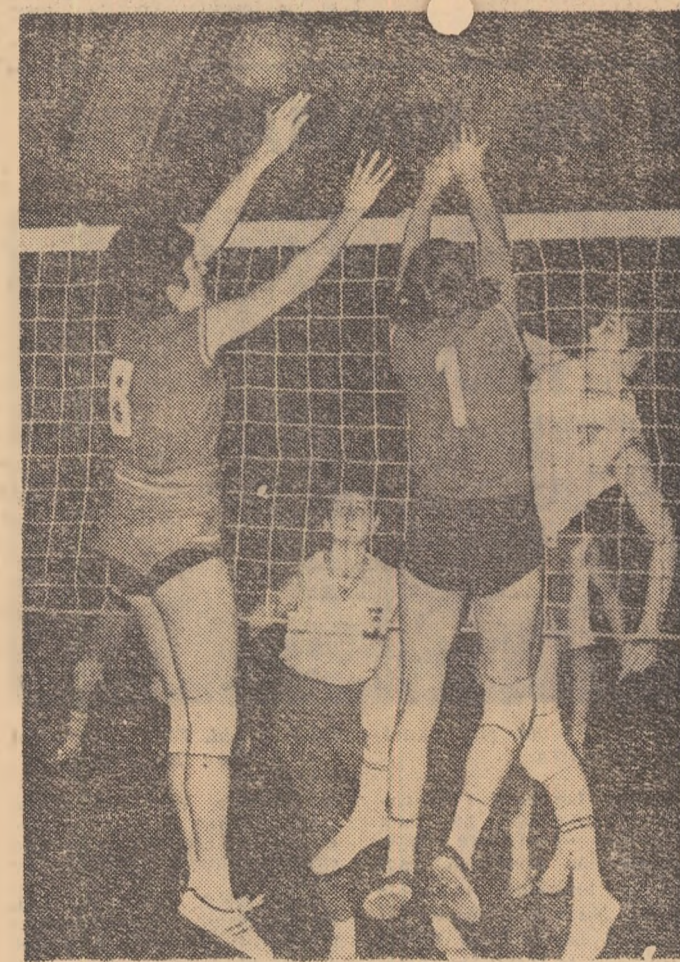
Aspect de la jocul de verificare dintre Dinamo și I.E.F.S.