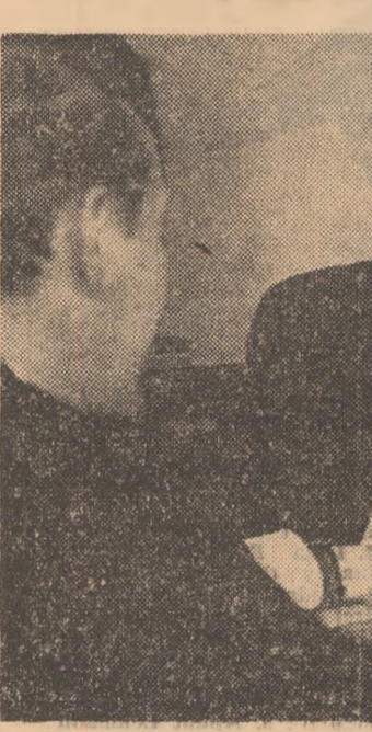
bunele au fost arhipline. Noi am condus cu 1-0 și 2-1, dar rezultatul final (2-2) oglindește just, după părerea mea, raportul de forțe. Totuși, „Daily Graph” scria în titlu: „Hearst a smuls un punct echipei vizitatoare”.

— fotbalistii români nu ar fi pierdut în fața campioanei Ghana”. După trei zile, beneficiind de două antrenamente de acomodare, la condițiile locale, echipa noastră a practicat un joc mai bun și, spre surprinderea generală, a terminat repriza a doua foarte puternic, câștigînd cu scorul de 3-2. La cel de al treilea meci, tri-