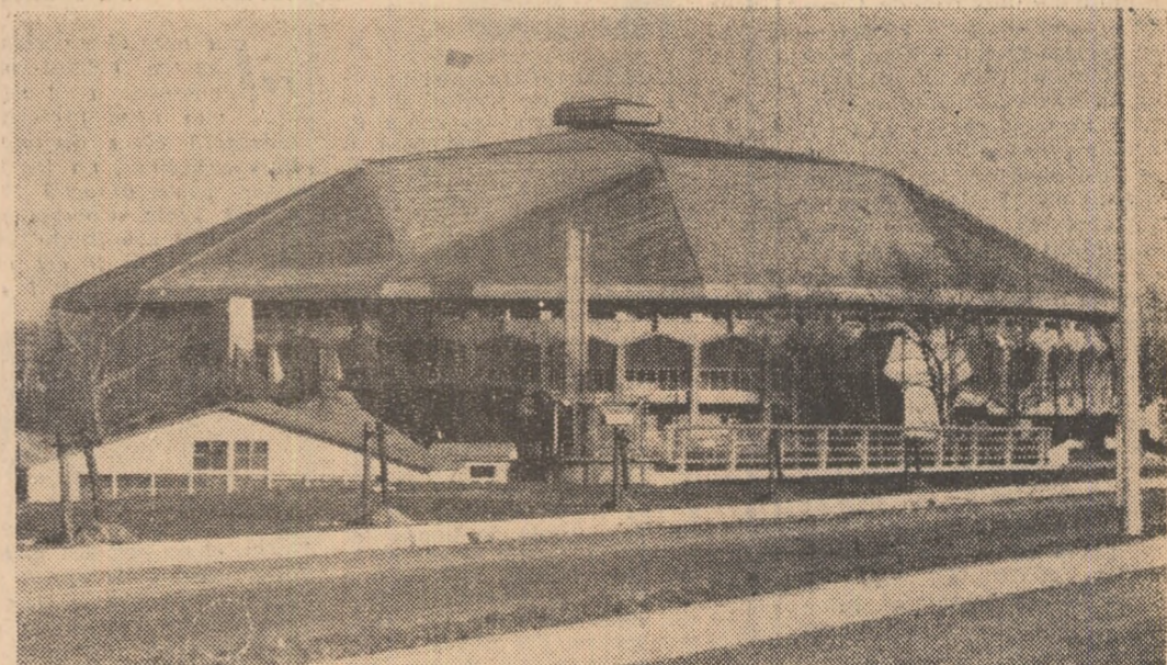
O avangardă a întrecerilor în orașul viitoare „Olimpiade albe” — Sapporo '72

De altfel, concursul de astăzi este deosebit de util pentru membrii echipei naționale care de săptămîna viitoare urmează să participe la mai multe concursuri (F.I.S.—B) în Italia și Austria, ca și celorlalți schiorii frunțași ce vor lua startul în concursul internațional „Cupa 16 Februarie”, organizat de comisia de sport și turism a U.G.S.R. și la care s-a anunțat participarea o echipe de schiorii italieni.